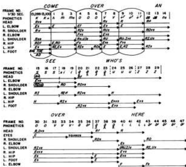
Figure 1. Lien entre les mouvements du nouveau-né et la voix d'un adulte. La transcription montre que les configurations de mouvement de l'enfant coïncident avec les segments articulatoires du discours de l'adulte. Notation: F, forward ou flex; H, stable; D, vers le bas; E, étendre; C, à proximité; RI, tourner vers l'intérieur; RO, tourner vers l'extérieur; AD, adduction; et U, en haut. Les lettres minuscules se réfèrent à la vitesse: s, légère; f, rapide; et vs, très léger (d'après Condon et Sanders, 1974a).

Condon et Sander (1974a) ont utilisé la microanalyse de film projeté sur un écran et de voix enregistrée pour étudier les liens entre vocalisations du donneur de soin et activité motrice du nouveau-né au cours d'interactions dans les premiers jours de vie. Ils ont distingué différentes configurations de mouvements (flexion, extension, rotation) et des éléments sonores du discours (phonème, syllabes, mot) (Figure 1). Leur transcription a permis d'identifier ce qu'ils ont appelé des process units , c'est-à-dire une forme comportementale organisée articulée soit avec le locuteur lui-même ( self-synchrony ) soit avec l'auditeur ( interactional-synchrony ). Elle révèle un lien temporel étroit entre la vocalisation des donneurs de soin et l'activité motrice des nouveau-nés, qu'ils décrivent comme une danse avec le langage humain. Le nourrisson apparaît comme un participant dès le départ dans de multiples formes d'organisation interactionnelle (Condon et Sanders, 1974b). Ces résultats ont été par la suite répliqués par Kato, Takahashi, Sawada, Kobayashi, Watanabe, & Ishii (1983) qui ont également montré que l'activité du nourrisson modulait également le discours de la mère.