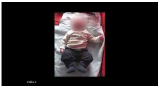
Figure 3. Image extraite du matériel dans la condition où les mimiques du nourrisson sont masquées (MOV).

Dans un second temps, un traitement des séquences de films a consisté à créer une version dans laquelle les mimiques des enfants sont masquées à l'aide d'un cercle flouté positionné sur le visage (Figure 3) et le son des films coupé. Ces séquences MOV n'offrent comme seuls indices aux participants à la recherche que les mouvements du nourrisson alors que les séquences initiales ECO laissent à disposition les mouvements, les mimiques et les vocalises.