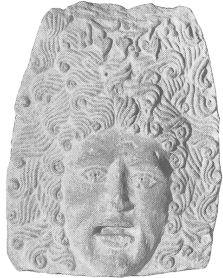
Fig. 46 — Rasteau (Vaucluse). Masque de Bacchus.

ge remarquable de l'influence du théâtre sur l'image divine elle-même, en dehors de tout rôle scénique particulier.