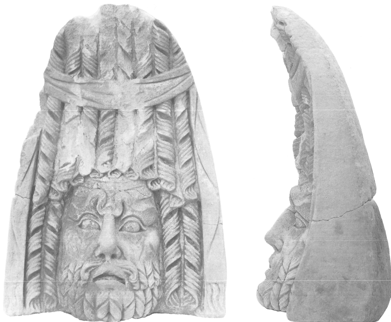
Fig. 43 — Masque 1 : vieillard tragique.

des défauts de la pierre plutôt que des larmes, comme on l'avait cru un moment. La bouche est fine, faiblement ourlée, formant une cavité profonde. Le menton est prononcé, un peu relevé en avant. J.-P. Cèbe y voyait Mégare, l'épouse d'Hercule.