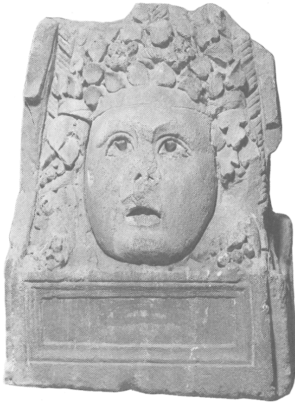
Fig. 45 — Vienne (Isère). Masque de Bacchus.

Mais il faut rapprocher surtout d'une série de quatre masques sculptés en faible relief sur un tombeau de la via Appia près de Rome 18 . On y reconnaît un Bacchus identique, avec la même coiffure 19 . Ce tombeau romain fournit d'ailleurs la comparaison la plus significative pour comprendre les masques de Cucuron. Les quatre figures présentées constituent un mélange assez hétérogène : Sol, Jupiter, Bacchus et Hercule, mais elles ont pour point commun d'avoir l'onkos des masques dramatiques, témoigna-