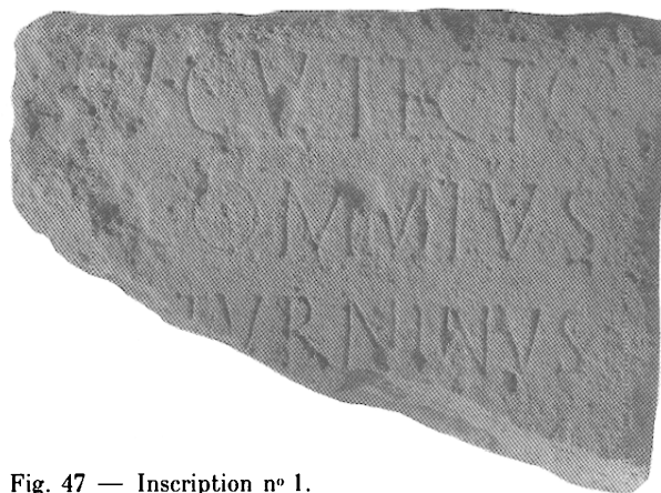
Fig. 47 — Inscription n° 1.

l. 2 : avant le gentilice Commivus , il y a une place pour un prénom abrégé en une lettre. Bien que le nom du dédicant ait pu ne comporter qu'un gentilice