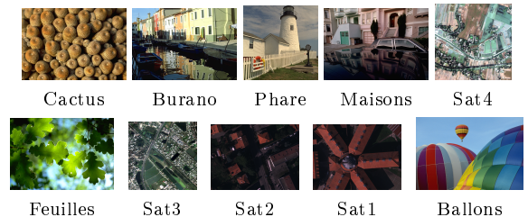
FIGURE 1 – Images de références utilisées pour les tests.

Dans ce paragraphe, nous avons comparé les méthodes mentionnées en simulant une image panchromatique et une image multispectrale à partir des images de la Figure 1, en suivant le modèle (1).