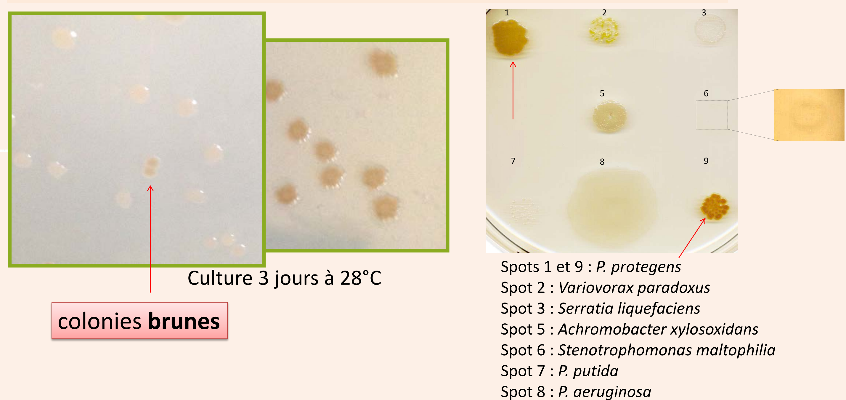
Figure 1 : exemples de croissance bactérienne observée sur milieu M9-PP-Agar