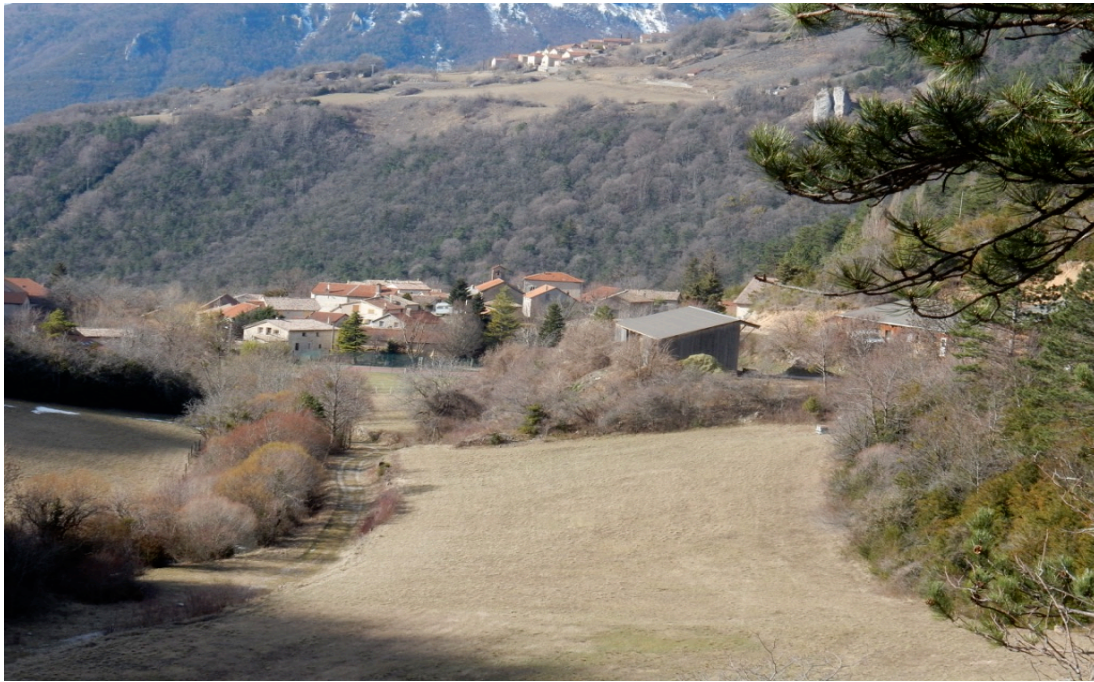
Les Nonnières au premier plan. En face, le hameau de Bénévisse.