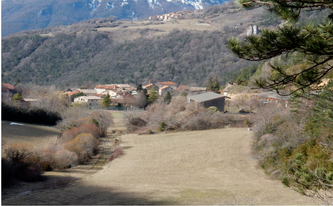
Les Nonnières au premier plan. En face, le hameau de Bénévisse.