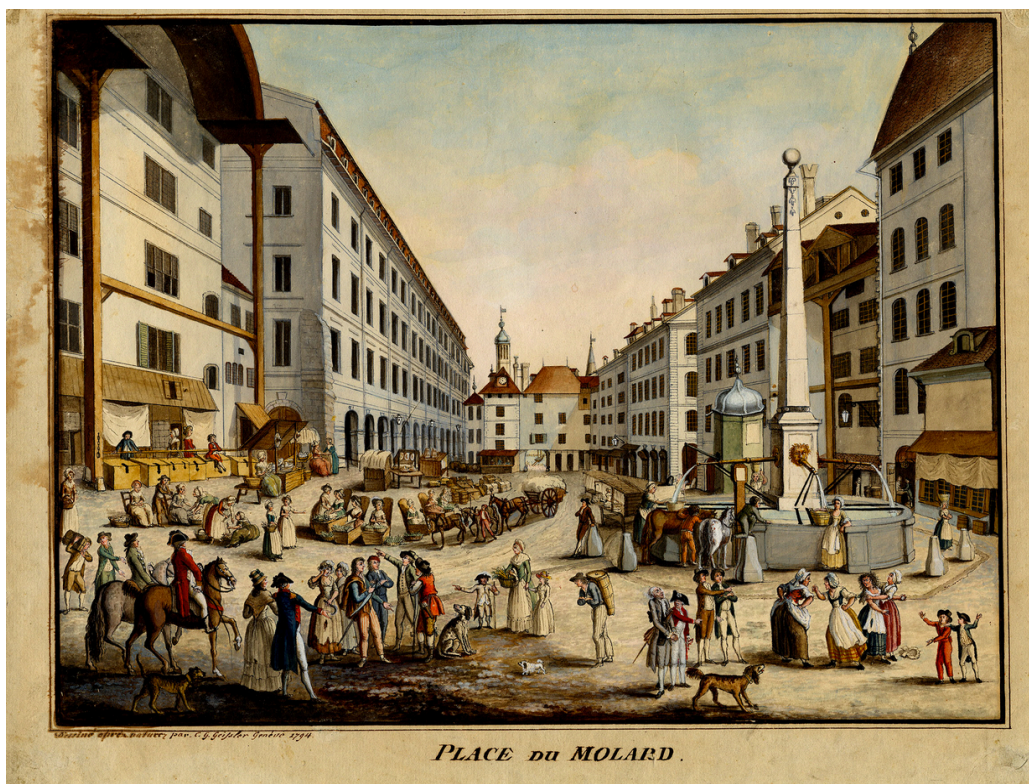
"Vue de la place du Molard en 1794. Aquarelle. Dessiné d'après nature par C. G. Geissler, Genève, 1794"