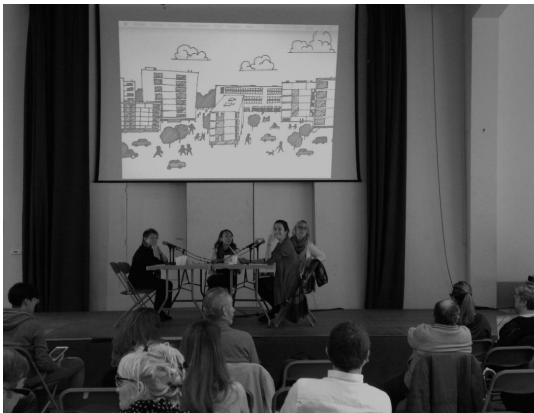
Figure 3: le plateau radio