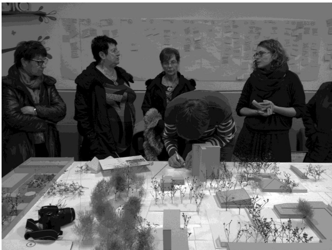
Figure 3 : les habitants, les étudiants et leurs maquettes