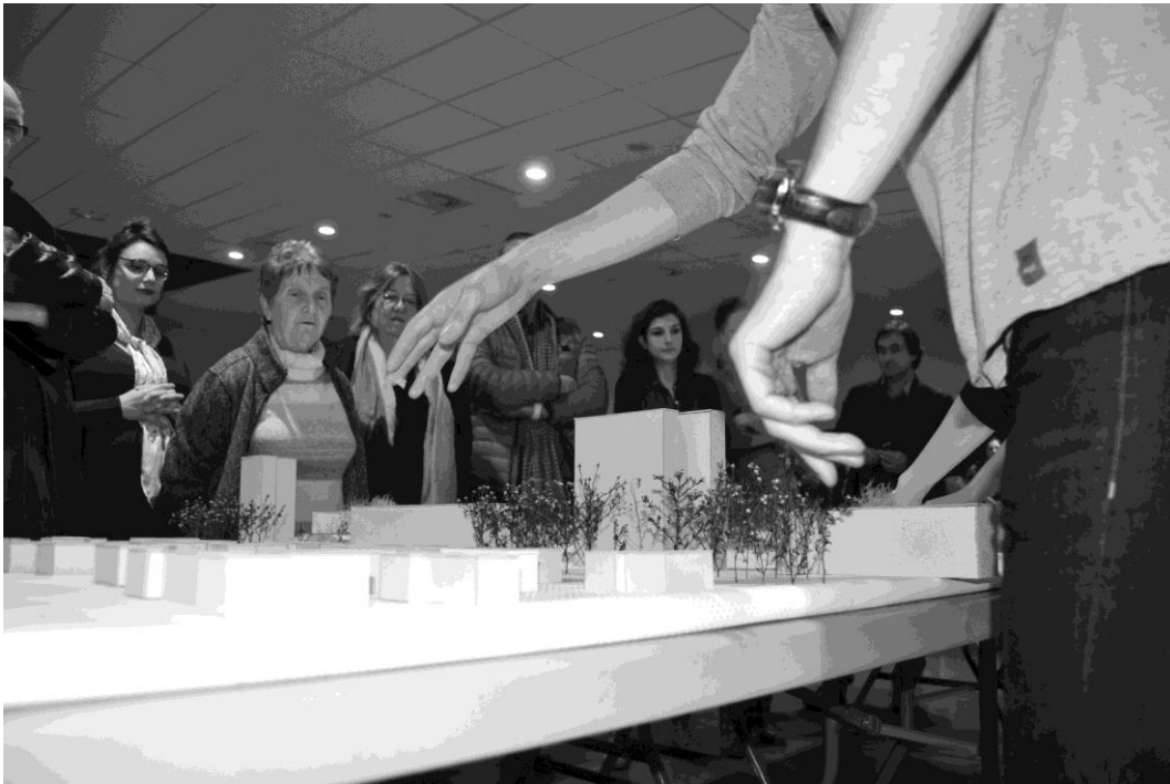
Figure 4: la maquette comme dispositif de négociations

avec le potlatch 16 , un système de dons / contre-dons dans le cadre d'échanges non marchands. Le jeu, dépense pure dans sa vocation première, est aussi l'occasion d'une remise à plat des enjeux économiques et sociaux. C'est comme nous l'avons vu le début d'une nouvelle cristallisation de rapports aux territoires, une nouvelle mise en jeu.