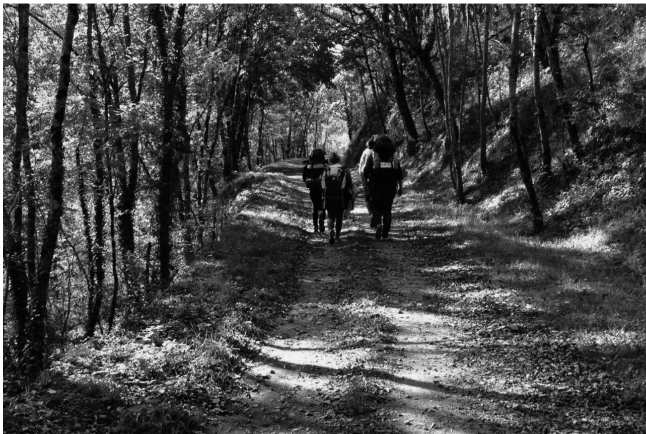
Figure 1 : Quatre étudiantes et étudiants marchant dans le cadre d'un dispositif de transect sur les traces de l'ancienne voie de chemin de fer entre Lamastre et les Nonières en Ardèche

L'hypothèse repose ici sur une compréhension singulière du paysage. Tel que convoqué par ces marches et ces projets, le paysage n'est pas tant lié à la vue qu'à sa mise en forme par ses habitant-e-s (Jackson, 2003 & Ingold, 2011). La marche préconisée se soustrait alors à la passivité contemplative, pour s'inscrire dans une position plus dynamique liée aux activités qui composent ce paysage. Etant donné que les pratiques et usages – comme habiter ou marcher – ne s'inscrivent pas dans ou sur un paysage mais donnent forme au paysage (Ingold, 1993), dire que par ces marches nous marchons dans un paysage serait réducteur. Afin de réhabiliter l'action performative de la marche nous employons l'expression marcher le paysage. Alors que nous le marchons, nous le réalisons.