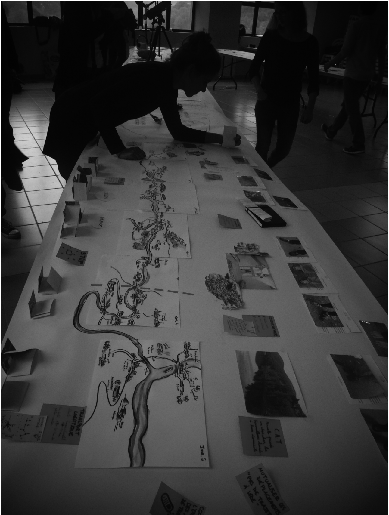
Figure 2 : À l'issue de trois jours de marche, restitution des rencontres, étonnements et pistes de projet sous la forme d'une coupe aussi appelée « table longue »