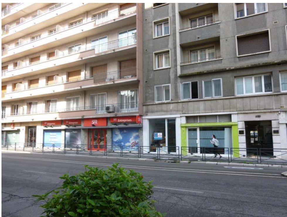
Figure 3. Utilisation de la vitrophanie pour composer les vitrines