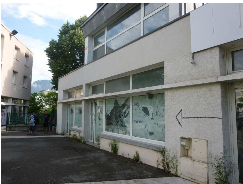
Figure 5. Cellule commerciale vacante depuis 2007

Cette troisième séquence est marquée par une vacance commerciale de longue durée située uniquement au sud-est de l'avenue, dans le quartier Teisseire. Celui-ci fut construit dès 1950 et marqué par un projet de renouvellement urbain porté par l'architecte et urbaniste Philippe Panerai de 1997 à 2007. La majorité des habitants sont issus de classe modeste. Les commerces de ce quartier sont situés dans des bâtiments neufs et surélevés par rapport à la place publique dessinée par Philippe Panerai. Cet ensemble contient une dizaine de locaux appartenant majoritairement au bailleur social Actis et comprenant quatre cellules vacantes, dont deux restées vides depuis la livraison de cet aménagement.