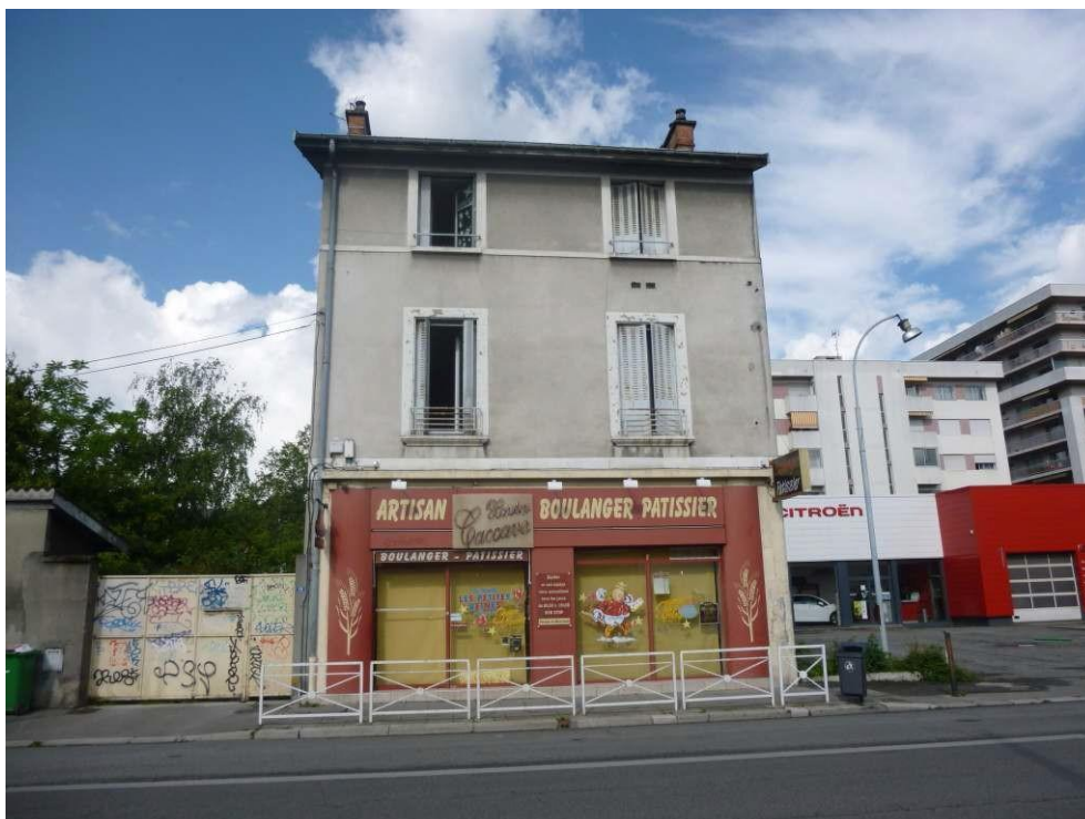
Figure 4. Local vacant, anciennement utilisé comme boulangerie

Située dans la partie centrale de l'avenue, cette séquence est caractérisée par une vacance commerciale isolée. Seulement trois locaux sur douze sont vacants, cependant ces espaces sont fortement perceptibles depuis les espaces publics environnants. Les vitrines de ces locaux vacants sont parallèles à l'infrastructure routière et forment des surfaces importantes.