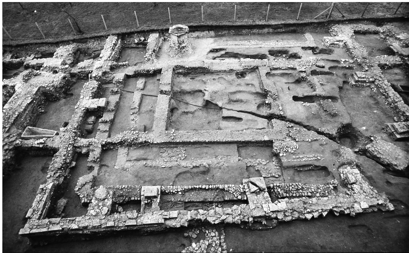
Fig. 194 – Vue du temple de l'abbaye Saint-Georges à Saint-Martin-de-Boscherville (Seine-Maritime), au milieu du préau du cloître.

Une petite fosse rectangulaire dans la partie est de la salle, entre deux rangées de tombes, semble correspondre à l'emplacement d'une pierre d'autel. La conversion de la cella antique en édifice