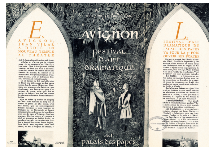
Fig. 3 Programme de 1949 recto.