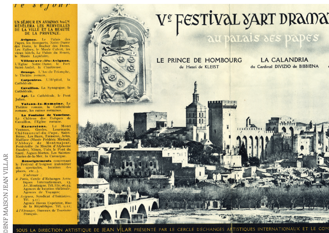
Fig. 5 Programme de 1951 recto.

CLOITRE DES CARMES Theatre de Liberte du 15 au 19 juillet Pourquoi Benerdji s'est-il suicidé ? de Nazim Hikmet Mise en scène : Mehmet Ukyay