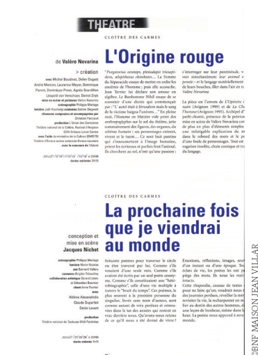
Fig. 7 Pages intérieures du programme, 2000.