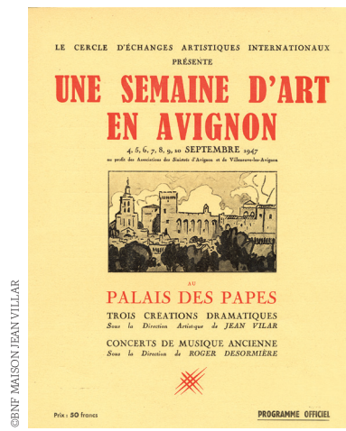
Fig. 1 Couverture du programme de 1947.

Enfin, un mouvement progressif de patrimonialisation du Festival se dessine. Il débute avec les fiches d'archivage des spectacles des années précédentes et s'exprime dans les éditoriaux ou dans la composition du logo du Festival qui inclut les clés du blason de la ville d'Avignon. En ce sens, le Festival devient patrimoine et contribue à la patrimonialisation des lieux historiques dont il est issu. Du fait de l'enchevêtrement des figurations et représentations, ainsi que de la circulation de cette imagerie, les lieux théâtraux du Festival d'Avignon représentent des référents culturels de la théâtralisation tout comme leur image est devenue un marqueur supplémentaire de la patrimonialisation des monuments.