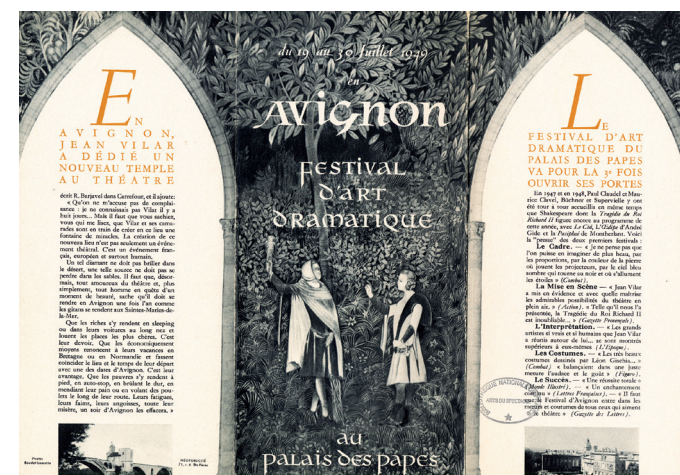
Fig. 3 Programme de 1949 recto.