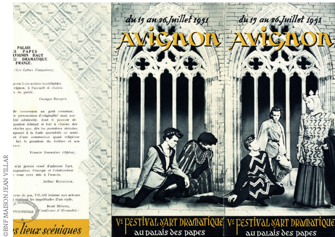
Fig. 4 Programme de 1951 verso.