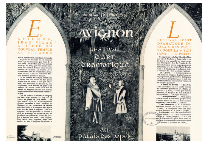
Fig. 3 Programme de 1949 recto.