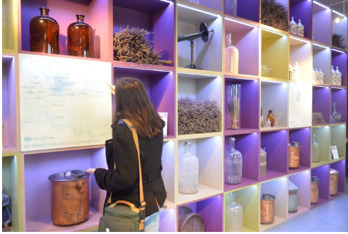
3a. Scénographie entrée du musée de la lavande