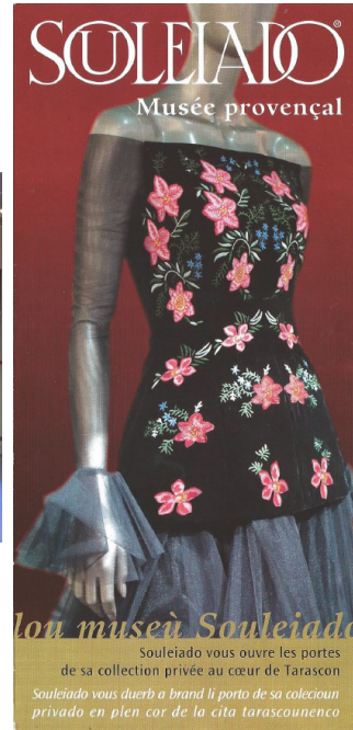
3b. Premier volet du musée Souleiado