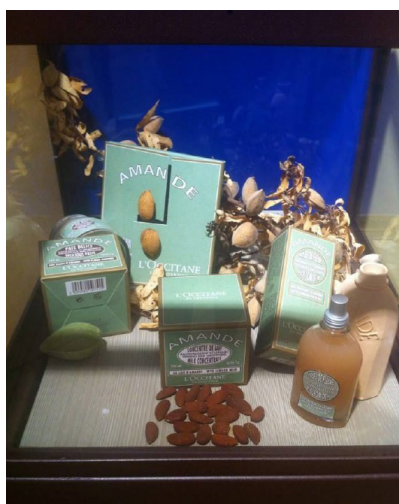
4a. Scénographie vitrine « Amande » l'Occitane Figure

Relevons en outre que cette sacralisation de la trouvaille, cette mise en exergue du trésor, semble dans le cas des musées d'entreprise être particulièrement utile, car elle est à même de pouvoir se déplacer sur le savoir-faire et donc les secrets de fabrication. In situ , la préciosité des expôts est matérialisée par les lumières et les vitrines qui protègent parfois des objets pourtant très récents et produits en millions d'exemplaires, à l'image des produits et des packagings l'Occitane.