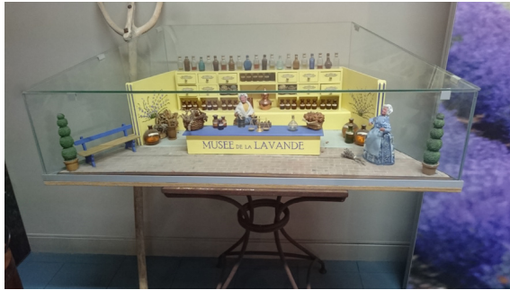
1a. Maquette sans étiquette - Musée Lincelé

D'autre part, dans l'ensemble des musées étudiés, la nature des objets exposés (datation, provenance, statut) n'est pas systématiquement précisée. Les informations scientifiques sur les expôts restent très parcellaires. Cette faiblesse des indications tend à donner l'impression qu'associer, voire accumuler, puis exposer des objets anciens dans des vitrines serait suffisant pour faire de cet ensemble d'objets une collection.