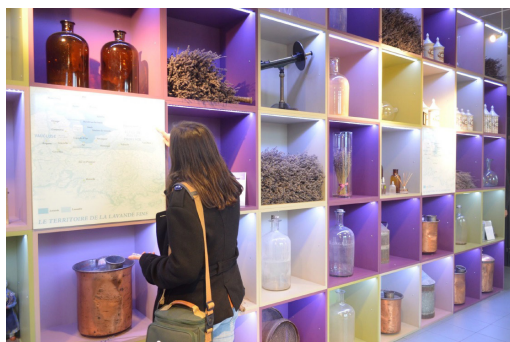
3a. Scénographie entrée du musée de la lavande