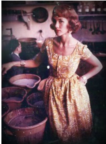
2c. Illustration photographique issue du site web du musée Souleiado

Figure 2. Évocation du passé par les mises en forme des supports de communication