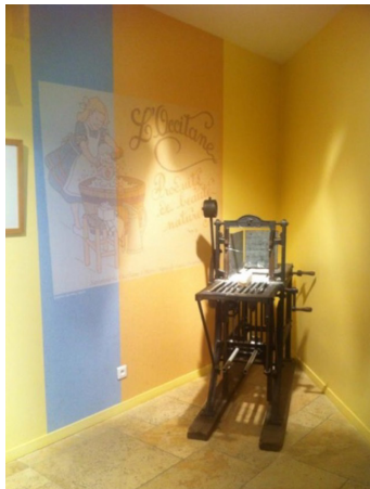
1b. Machine sans étiquette - Musée l'Occitane