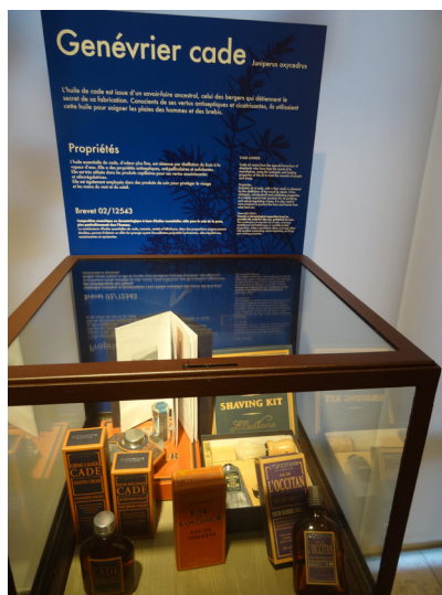
Vitrine l'Occitane avec cartel