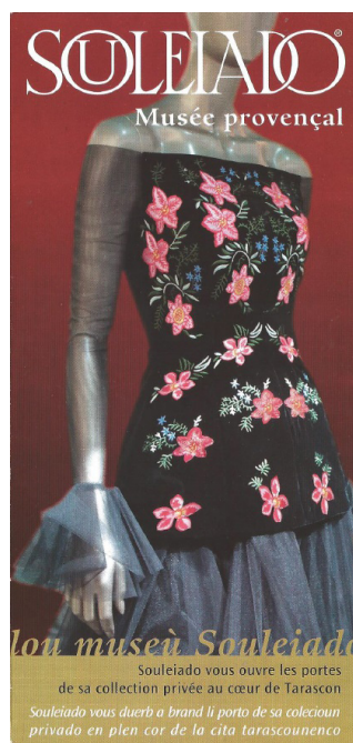
3b. Premier volet du musée Souleiado