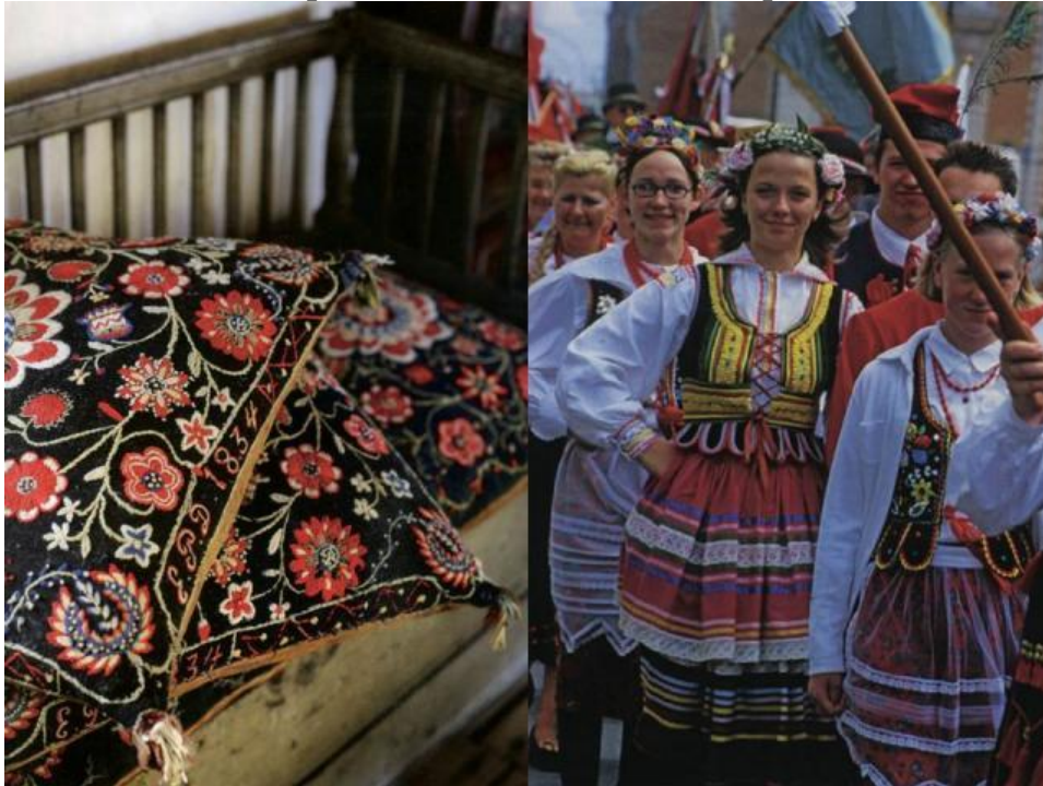
Figure 7. Mise en avant de la polonité et de ses codes esthétiques