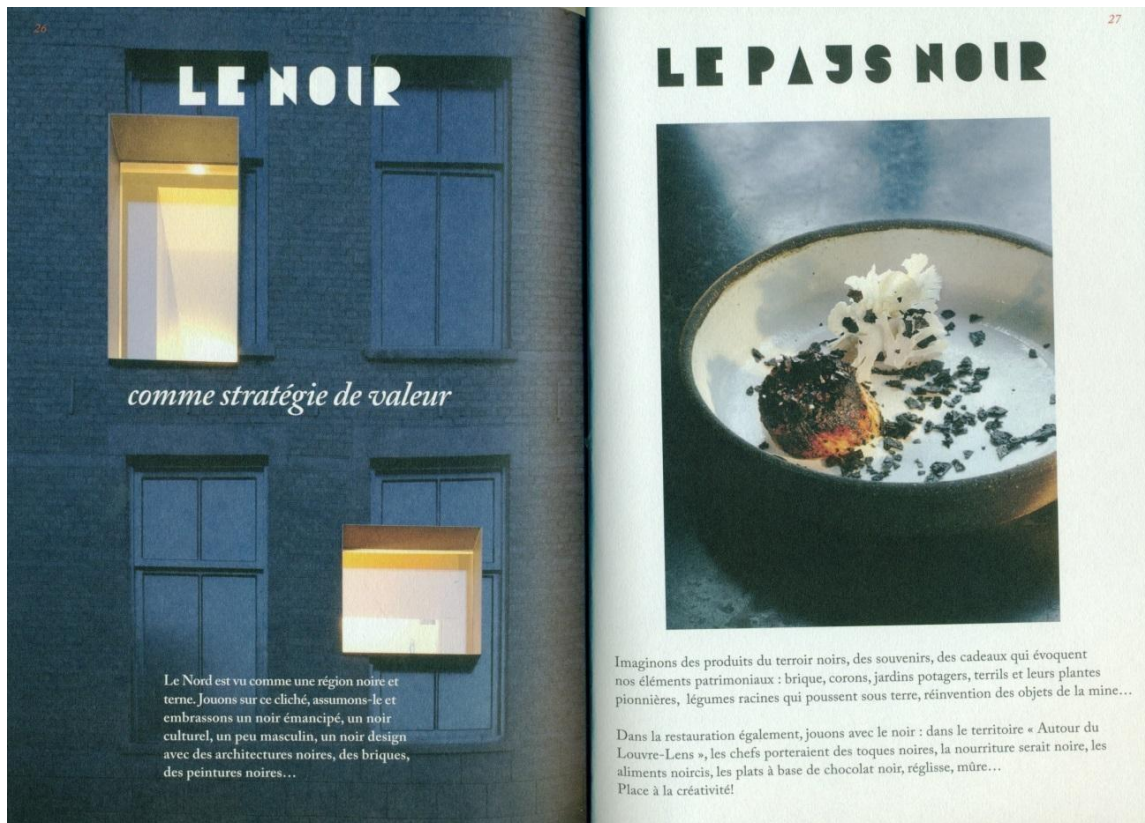
Figure 2 : Extrait du carnet de tendance 1 « Valeurs » d'AAL présentant le noir comme un atout