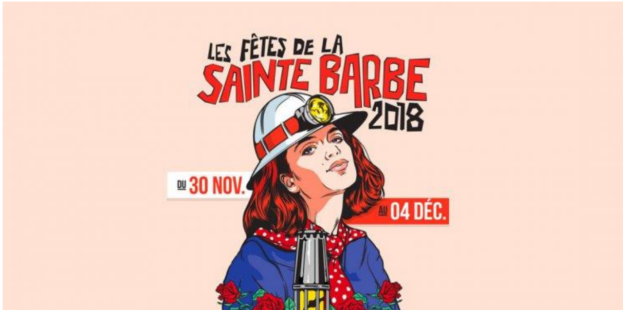
Figure 9. Réinvestissement iconographique et symbolique de la Sainte-Barbe

tout un pan de l'histoire du bassin minier : l'histoire des catastrophes ou celles des luttes sociales en proposant aux visiteurs une image lissée et exotique. Le réinvestissement de la fête de la Sainte-Barbe par la MLLT depuis décembre 2018 en est un bon exemple.