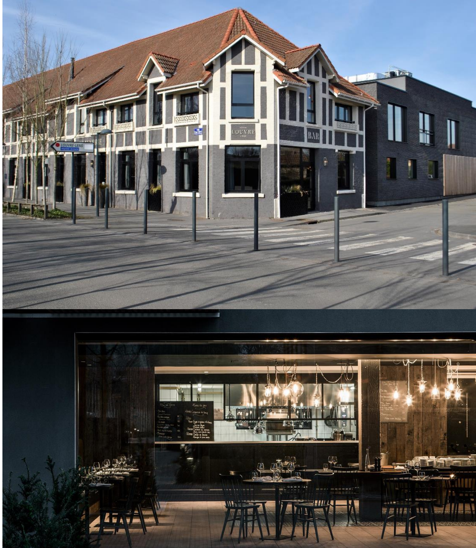
Figure 8. Le nouvel hôtel quatre étoiles devant le Louvre Lens