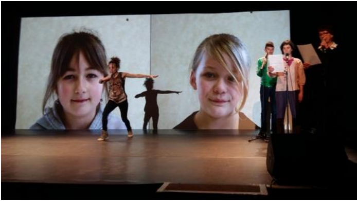
Extrait du spectacle de restitution.

à un comédien avec du Beckett 23 et une multitude d'anecdotes sur la cité. Ici, la cité en tant que bâti devient un support à l'évocation d'un patrimoine immatériel et le quotidien, voire l'intime, sont hissés au rang de patrimoine à conserver et à protéger tout autant que les murs.