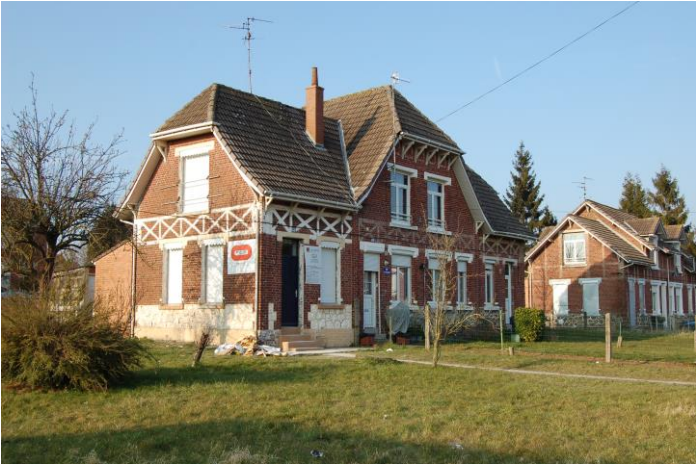
Exemple d'une maison partiellement rénovée, Camille Mortelette, mars 2016

Située en périphérie du centre-ville de Lens, la cité fonctionnait autrefois en relative autonomie grâce aux nombreux commerces et services qui étaient censés répondre aux besoins principaux des habitants 6 . Aujourd'hui, on peut encore compter quelques équipements publics (une école, les locaux de l'inspection nationale, une amicale des aînés). On y trouve également un collège et un lycée professionnel à proximité, sans oublier la base du 11/19 7 qui accueille Culture Commune, le Centre Permanent d'Initiatives pour l'Environnement (CPIE) « Chaîne des Terrils » et des entreprises liées au développement durable. Mais l'église