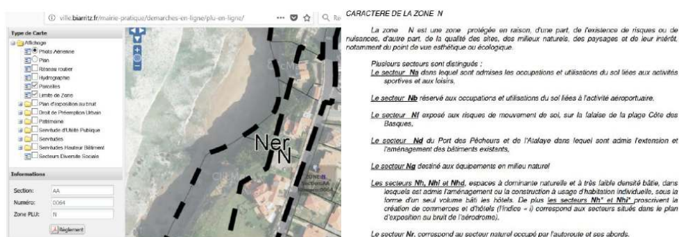
Figure 3. Cartographie PLU sur un secteur de Biarritz et règlement PLU zone N associé.