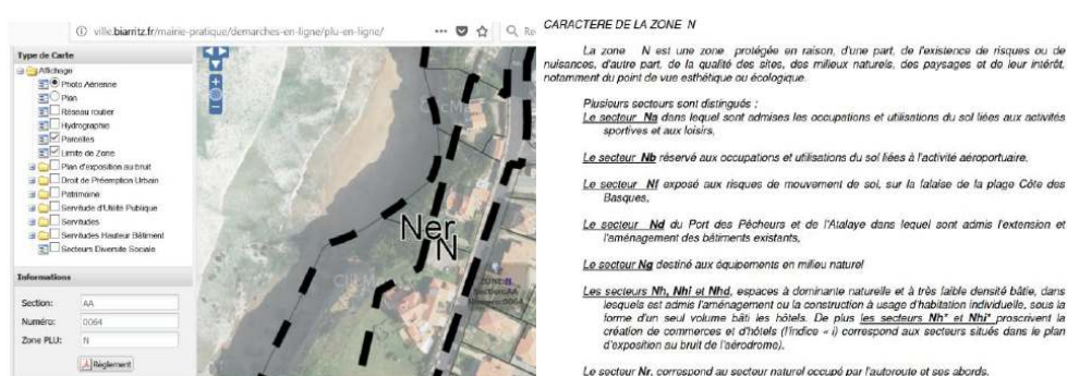
Figure 3. Cartographie PLU sur un secteur de Biarritz et règlement PLU zone N associé.