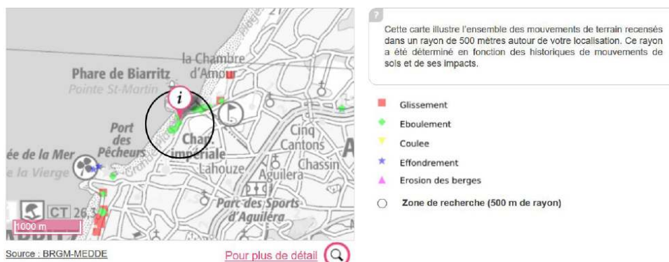
Figure 4. Visualisation des aléas côtiers dans l'interface Géorisques .

« mouvement de terrain » cartographie précisément la localisation des aléas, mais malheureusement l'onglet « pour plus de détails » n'aboutit pas.