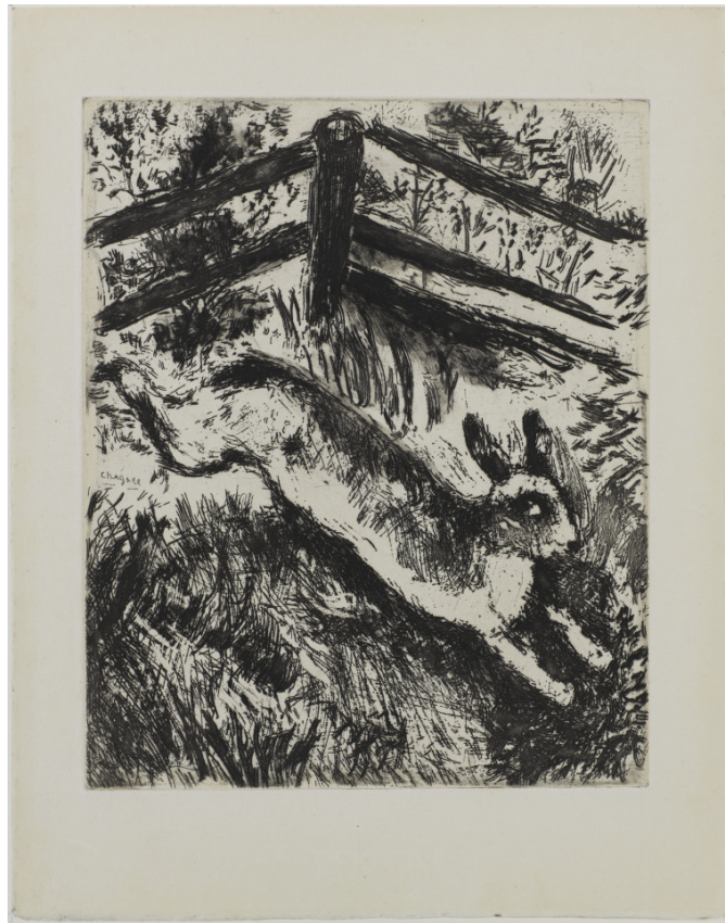
[FIG. 9] Marc Chagall, « Le lièvre et les grenouilles », eau forte sur vélin, pour Les Fables de La Fontaine , 1952, Paris, Centre Pompidou [ADAGP Paris].