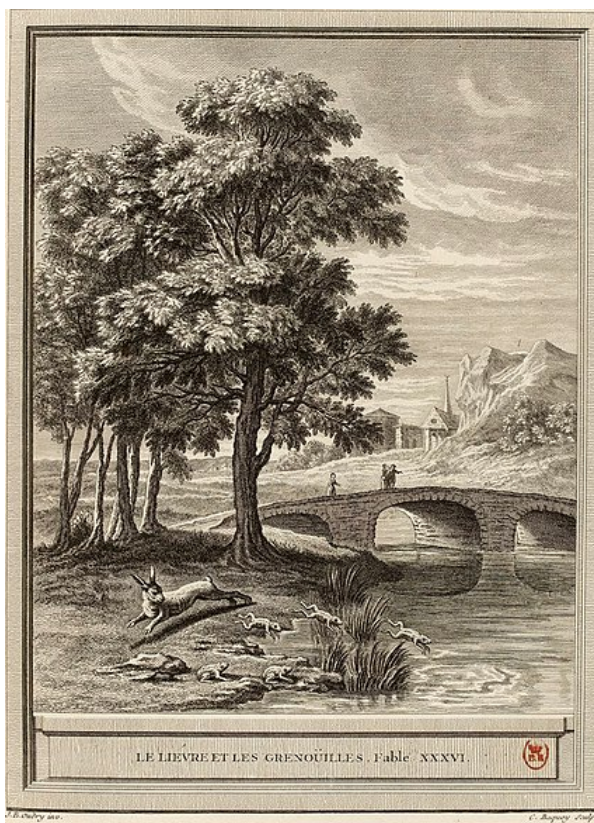
[FIG. 5] Gravure de Jean-Charles Baquoy, d'après Jean-Baptiste Oudry, dans La Fontaine, Fables choisies, Paris, Desaint & Saillant, 1755-1759, t. I, livre 2, fable 36, p. 72.