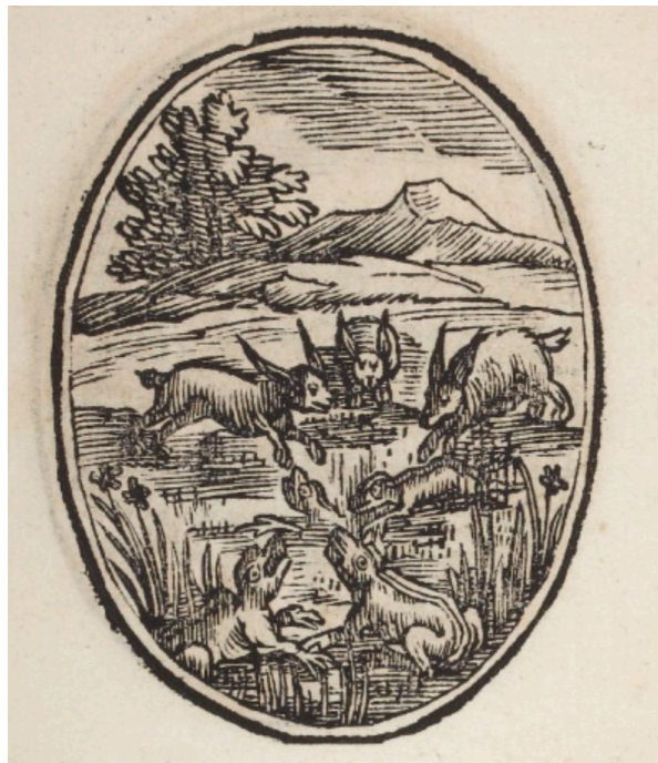
[FIG. 2] Isaac de Benserade, Fables d'Ésope en quatrains dont il y en a quelques parties au labyrinthe de Versailles, Paris, chez Sébastien Mabre-Cramoisy, 1678, « Le Lièvre et les Grenouilles », fable CLX, p. 161.