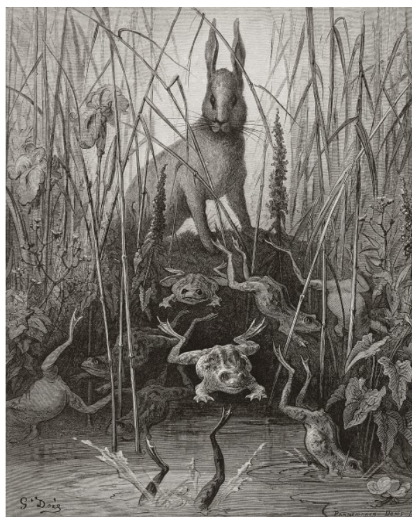
[FIG. 6] Dessin de Gustave Doré, gravure sur bois d'Adolphe Pannemaker et Albert Doms, Paris, Louis Hachette, 1867, t. 1, p. 88.