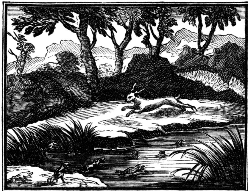
[FIG. 4] Gravure de François Chauveau, dans La Fontaine , Fables choisies mises en vers par M. de La Fontaine , Paris, Claude Barbin, 1668, Livre II, fable Quatorziesme, p. 77.