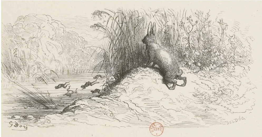
[FIG. 7] « Le lièvre et les grenouilles », dessin de Gustave Doré, gravure de Jean-François-Prospér Delduc, dans La Fontaine, Fables , Paris, Louis Hachette, 1868, p. 107.