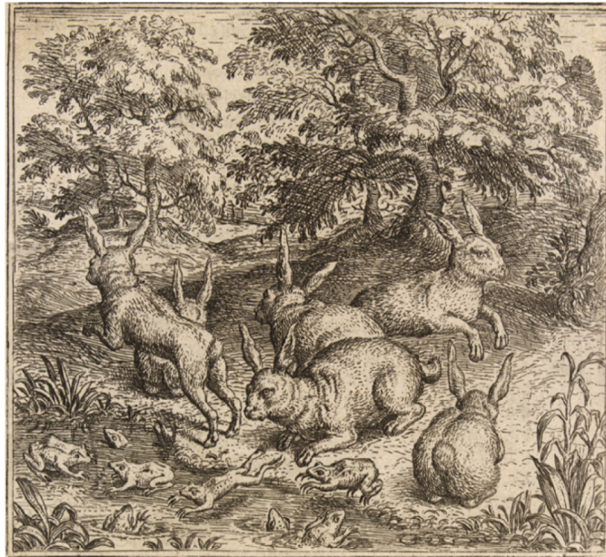
[FIG. 1] Marcus Gheeraerts, The Hares and the Frogs , dans Edvard de Dene's De warachtigen fabulen , Bruges, 1567, fol. 64 [La Haye, Royal Library].