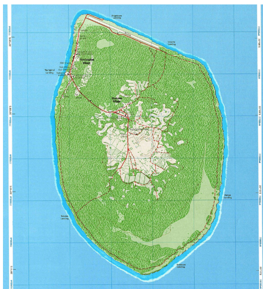
CARTE 2. – Carte de Ma'uke

et notamment de ses mangues. Le centre de l'île est couvert de plusieurs centaines de spécimens. Le manguier est le dernier avatar de la production agricole de Ma'uke qui a connu ses heures de gloire dans les années 1940-1960 avec la production d'agrumes (Johnston, 1951). Mais, en raison de la concurrence exercée par d'autres pays producteurs et des coûts de transports trop importants qui caractérisent l'économie insulaire, cette activité a périclité dans les années 1980, laissant derrière elle de vastes étendues d'arbres sans aucune forme d'exploitation commerciale.