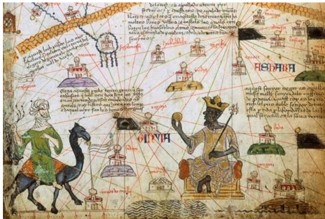
Manuscrit enluminé sur parchemin, 1375. BnF, département des Manuscrits https://gallica.bnf.fr/ark:/12148/btv1b55002481n/

Ces deux perspectives s'entremêlent pour construire des représentations et un imaginaire de l'« Afrique noire », entre terreur et fascination.