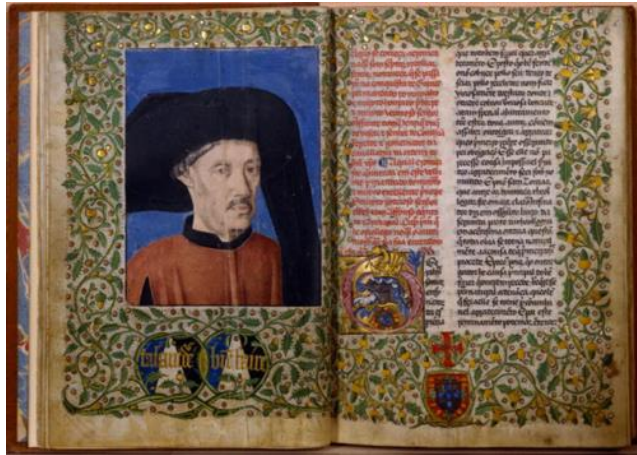
Portrait d'Henri le Navigateur dans la Chronique de Guinée (1453)