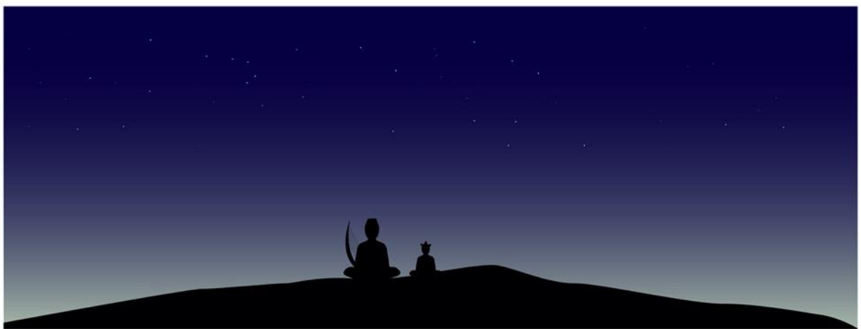
Seconde interface inspirée de Michel Ocelot