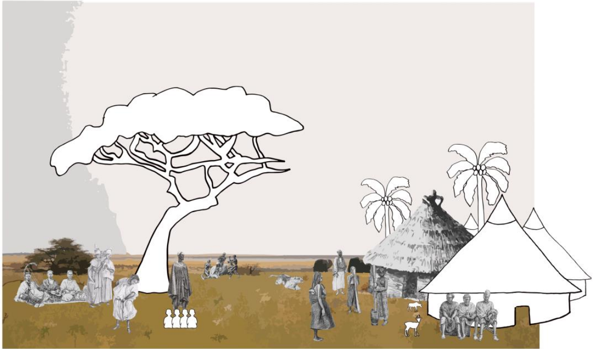
Première interface de l'espace culturel africain