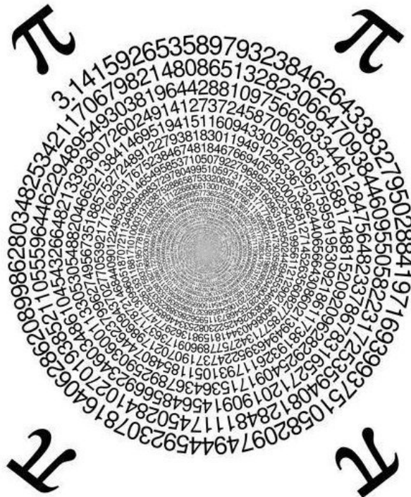
Figure 2 : La représentation circulaire de Pi.

Sans une fenêtre de « Temps Pi » ouverte vers l'irrationnel, nous ne réchauffons que le passé et ne répétons que ce que nous connaissons dans la bulle d'espace-temps de l'horizon des événements permis par notre conscience et notre propension à chercher des causes. Nous risquons alors de devenir, métaphoriquement, comme un trou noir qui aspire toute la lumière et l'information et n'émet plus rien de vivant, de créatif et de nouveau autour de nous.