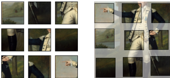
FIGURE 1 – Exemple de puzzle à 9 pièces. À partir d'un jeu de fragment (à gauche), l'algorithme prédit un réassemblage global. Pour faciliter la compréhension du résultat, nous affichons en transparence l'image originale et plaçons précisément les fragments d'après les positions relatives prédites (à droite)

Les méthodes d'apprentissage profond ont rencontré un franc succès pour la résolution de problèmes de vision par ordinateur classiques. Elles sont peu à peu appliquées à des tâches moins usuelles, comme la résolution automatique de puzzles (Figure 1). La plupart des travaux se concentrent sur les problèmes à 9 pièces. On utilise alors un réseau de neurones pour prédire un réassemblage imprécis, complété par la suite.