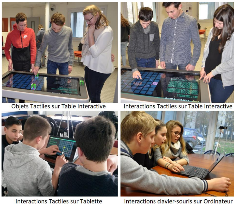
Fig. 3. TurtleTable avec ses 4 modes d'interactions

Afin de mesurer l'impact des interactions sur la motivation, la collaboration et l'apprentissage, nous avons expérimenté ses différentes versions de TurtleTable avec une soixantaine de collégiens. Plusieurs types de données ont été collectés. Premièrement, nous avons conçu des pré-tests et des post-tests afin de mesurer le niveau de connaissances des élèves sur les concepts vus dans le jeu (variables, boucles, conditions). Ce test se compose de 10 exercices, qui sont similaires aux niveaux dans le jeu : l'objectif est d'exécuter le programme en dessinant le chemin parcouru par les objets sur la grille. Les groupes ont également été filmés afin d'analyser les interactions entre sujets. Certains groupes ont également été questionnés en focus group pour comprendre leurs interactions. Pour finir, les sujets ont également répondu à un questionnaire final dans lequel on leur a demandé de classer les versions par ordre de préférence et de les qualifier avec des mots clés.