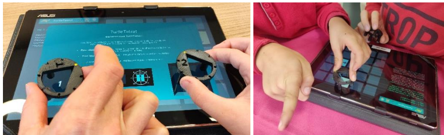
Fig. 4. Interactions avec des pièces tangibles sur tablette

L'utilisation de pièces tangibles sur tablette est très récente et concerne essentiellement des jeux vidéo ou des jeux de société qui proposent une extension numérique [23].