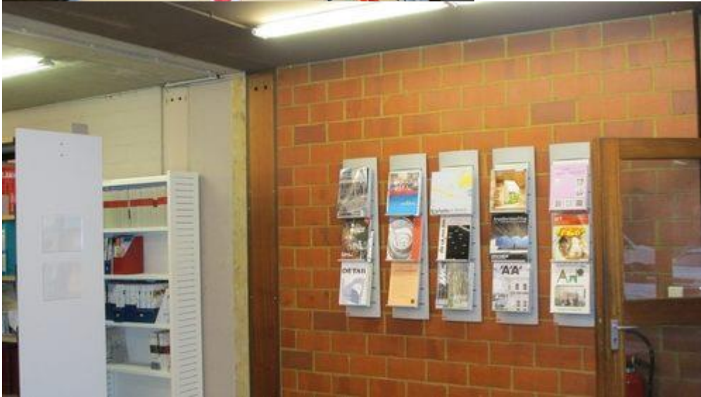
Bibliothèque BAIU Louvain La Neuve. Janvier 2019.