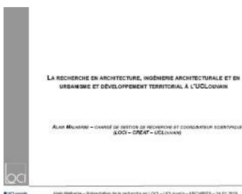
La recherche à l'UCLouvain par A Malherbe

A 10h30, Alain Malherbe (ULC-LOCI) présentait la recherche architecturale à l'Université de Louvain, ses différentes structures à l'échelle de l'Université.