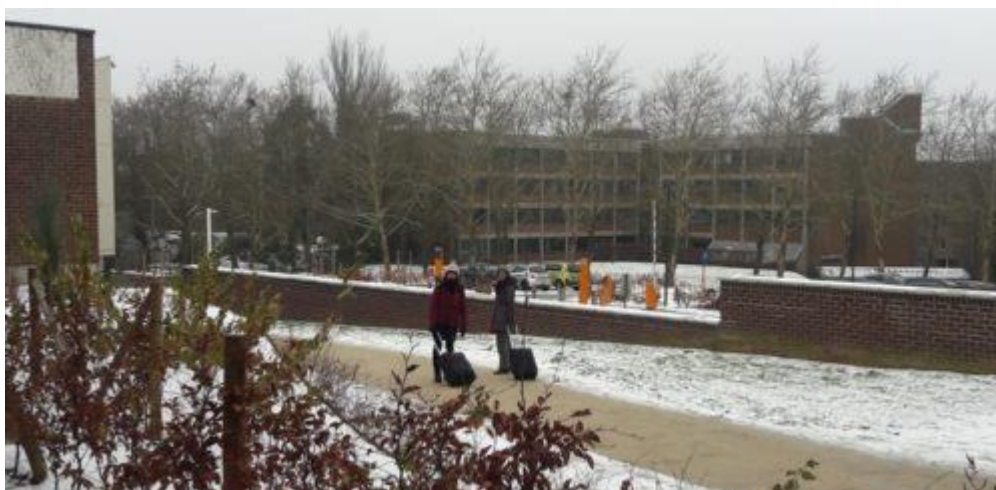
Louvain-La-Neuve, janvier 2019.