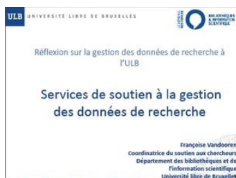
Le service de gestion de données de la recherche à l'ULB par F Vandooren

Ces aides peuvent prendre la forme de guides de bonnes pratiques, de cours en ligne, d'assistance personnelle, de vidéos, etc. Les différents services de soutien doivent être adaptés au public cible (doctorants, responsables de labos, chercheurs...).