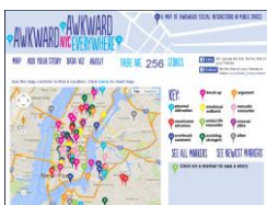
[ Awkward NYC ] (Marsh, 2012)

Déterminer ce qui constituait le script s'est avéré plus problématique que nous aurions pu le croire. Que traduit-on quand on travaille sur une œuvre hypermédiate, c'est-à-dire multimédia, où l'animation est omniprésente? Les productions hypermédiatees sont souvent entourées d'un abondant paratexte (liens, titres, menus, contacts, consignes etc.), dont on peut se demander s'il est constitutif ou non de l'œuvre et s'il est nécessaire de le traduire. C'est tout particulièrement pertinent dans le cas d' Awkward NYC , qui utilise Google Maps pour proposer aux internautes de placer, sur une carte du monde centrée sur New York, des marqueurs correspondant à une anecdote. Awkward NYC est donc une œuvre collaborative, en constante évolution. Elle contient tout un ensemble de directives et explications destinées à faciliter son utilisation par les internautes écrivains: