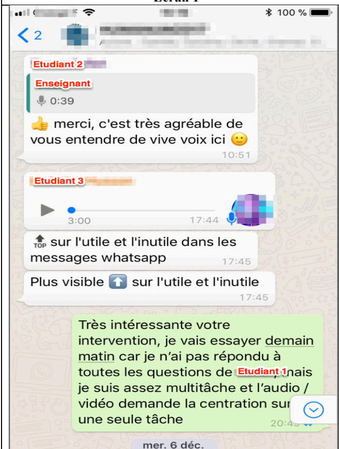
WhatsApp [W3] –Séquence : Transmission d'usages Ecran 2