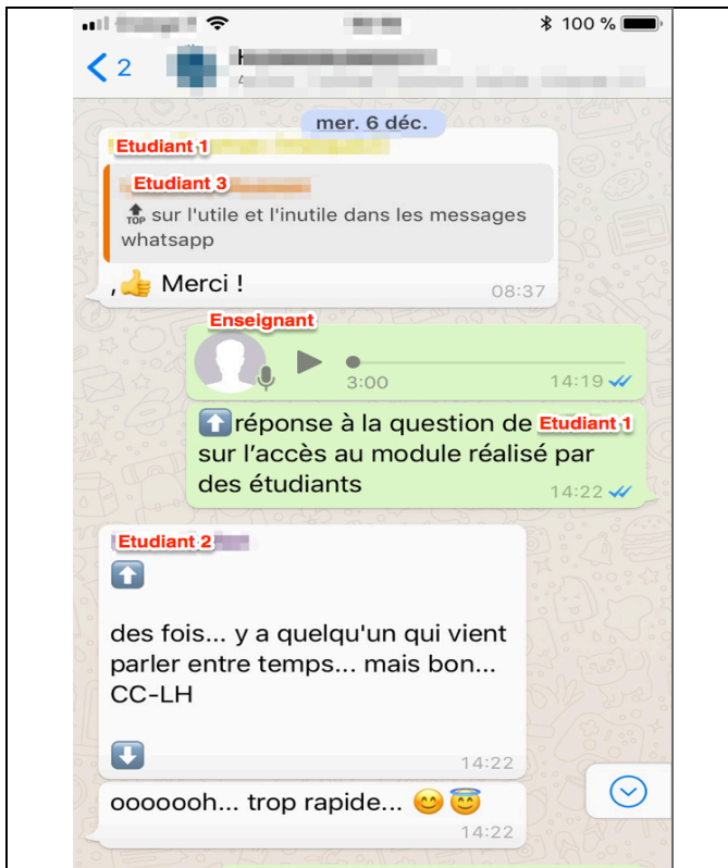
WhatsApp [W3] – Séquence : Transmission d'usages Ecran 3