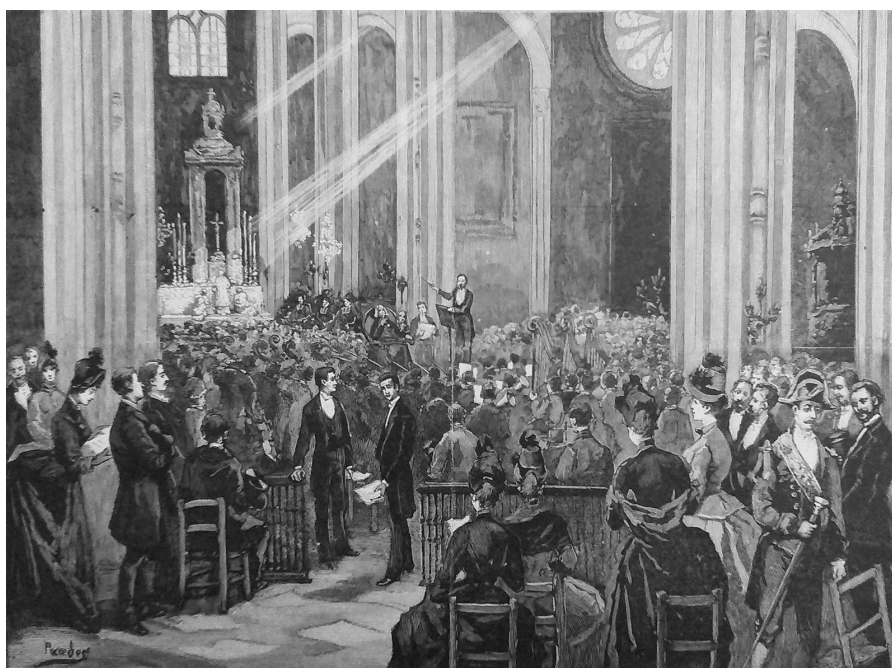
FIGURE 2 • M. Paredès, « La messe de Liszt à Saint-Eustache », musée Carnavalet, département des Arts graphiques, Topographie, 27C

En dépit de sa perspective écrasée – qui rend en particulier difficile la distinction entre l’axe de la nef et celui du transept – la gravure ci-dessus (voir Fig. 2) qui représente l’exécution de la Messe de Gran de Liszt donnée à Saint-Eustache en 1886 à l’occasion de la fête de la caisse des écoles du 2 e arrondissement, donne à voir plusieurs des transformations que nous évoquons : devant l’autel éclairé de rayons et où sont agenouillés, de dos, un officiant et deux enfants de chœur, on aperçoit une masse de musiciens qui jouent sous le regard de Liszt, juché sur une estrade. Postés aux deux extrémités d’une barrière, deux « pointeurs » contrôlent les billets de ceux qui se présentent à l’entrée de l’enceinte réservée, située juste devant l’orchestre.