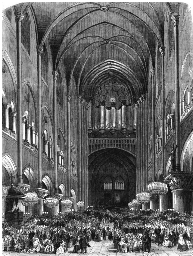
FIGURE 4 • « Inauguration du grand orgue de Notre-Dame », L'illustration , 51, 21 mars 1868, p. 191