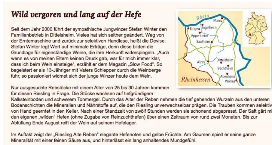
Figure 4. Construction hyperstructurelle et fixité thématique géographique