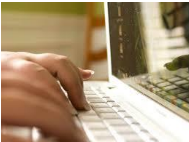
Ordinateur. Image libre de droit

Le référentiel d'évaluation du HCERES est très clair et se veut objectif et pertinent. Il présente tout d'abord le processus global d'évaluation