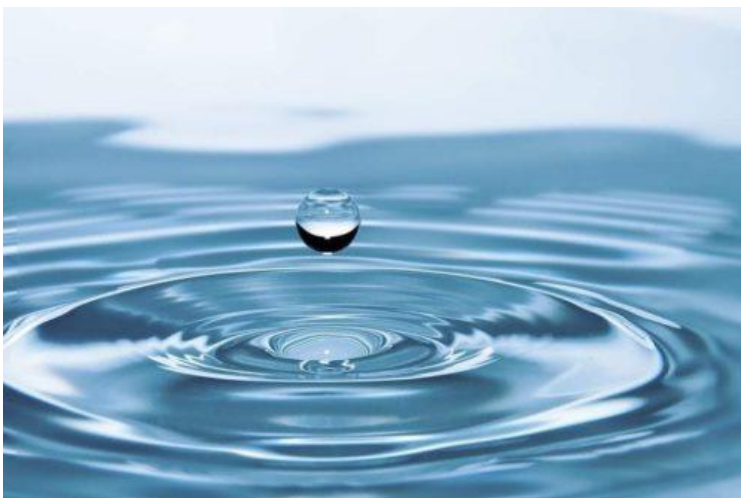
Goutte d'eau. Image libre de droits