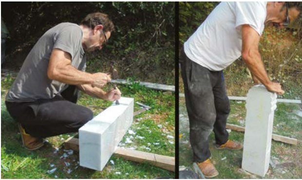
Fig. 4. Taille de la stèle par François Grand-Clément.

à lui donner l'aspect d'une stèle à anthémion conforme à ce que l'on connaît pour la fin de l'époque archaïque : une forme rectangulaire surmontée d'un décor de palmette stylisée (fig. 4). Le reste du décor était destiné à être rendu par la seule peinture iconographique principale.