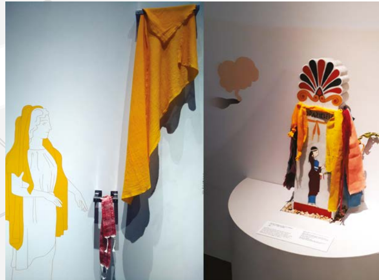
L'INVENTION DE LA STÈLE FUNÉRAIRE PEINTE : UN PROTOTYPE D'INSPIRATION HYBRIDE

que scénographique. Si pour la conception des panneaux et du visuel, les muséographes et graphistes 7 avaient privilégié des tons adoucis, certains plateaux sensoriels (palette de maquillage par exemple) et dispositifs visuels (autel avec offrandes végétales) introduisaient en complément des touches de couleur plus variées (fig. 1). Mais c'est sans conteste grâce au recours à l'archéologie expérimentale (teinture et peinture) qu'il a été possible de donner à voir aux visiteurs une polychromie plus vive, pour évoquer l'environnement coloré des Grecs. D'une part, plusieurs bandes et pièces de tissus de lin et de laine avaient été teintés avec l'aide d'artisans spécialisés : le voile de safran et la ceinture ornée de motifs de la mariée (fig. 2a), l'étoffe diaprée consacrée comme offrande devant l'autel, les manteaux de deuil... D'autre part, dans la section des funérailles, un prototype de stèle en marbre avait été peint pour évoquer la polychromie qui régnait au sein des nécropoles grecques (fig. 2b). C'est de ce dispositif expérimental dont il va être question ici, afin d'expliquer le mode opératoire suivi et le résultat auquel il a abouti 8 .