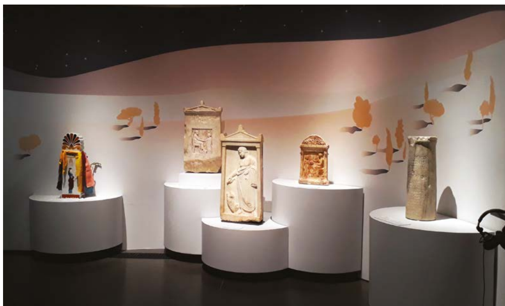
Fig. 3. Vue générale de la section des funérailles avec trois stèles et un cippe ainsi que, sur la gauche, la stèle expérimentale en couleurs créée de toutes pièces pour l'exposition ; on aperçoit aussi à droite un des dispositifs sonores de l'exposition.

relief. On peut légitimement supposer qu'il était également rehaussé de peinture à l'origine, comme le montrent de nombreux exemples, de l'époque archaïque jusqu'à l'époque hellénistique 11 . Nous ne disposons malheureusement pas de données archéométriques à ce sujet : aucune des trois stèles n'avait fait l'objet d'analyses spécifiques et leur surface ne laissait voir aucune trace de couleur visible à l'œil nu. Dès lors, comment sensibiliser les visiteurs de l'exposition au rôle joué par les couleurs dans les nécropoles et tenter de dissiper le mirage d'une "Grèce blanche" 12 ? Cette préoccupation nous a amenées à présenter, à côté des objets archéologiques, un essai de "reconstitution" polychrome. Le terme de "reconstitution" mérite ici une explication. Il ne s'agissait pas d'engager une entreprise analogue à celles menées par les équipes de V. Brinkmann, de P. Liverani ou de J.-S. Østergaard, qui visent à s'approcher au mieux, sous forme de reproduction matérielle – et non virtuelle –, de l'aspect qu'ont pu avoir certaines sculptures antiques sorties de l'atelier 13 . Nous avons pris délibérément la liberté de créer de toutes pièces un objet qui n'a jamais existé, en nous inspirant de plusieurs artefacts conservés. Nous avons veillé à respecter une stricte cohérence chronologique : les différents vestiges polychromes (stèles, reliefs, statues et tablettes votives) qui ont servi de référence