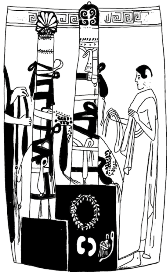
Fig. 9. Lécythe peintre de Vouini (vers 460-450 a.C.), New-York, Metropolitan Museum of Art, inv. 35.11.5 (dessin de N. Hosoi).

l'entrée du musée, où poussent deux beaux arbustes. Pour rehausser le parfum, quelques gouttes d'huile essentielle ont été ajoutées. Régulièrement, environ une fois par mois, le