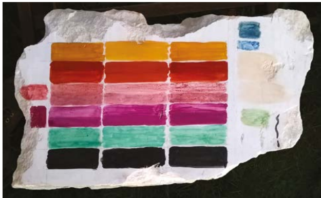
Fig. 6. Bloc de marbre avec des tests de couleurs réalisés à l'aide de différents liants (pigments : noir de vigne, vert malachite, cochenille, laque de garance, ocre rouge, ocre jaune / liants : œuf, cire et caséine) et quelques tests annexes en bordure.

directement sur la surface du marbre 20 : c'est donc ainsi que nous avons procédé. Nous avons également repris la plupart des pigments identifiés sur les monuments de Démétrias et pris en compte le fait que la présence d'huile et de protéines, sans doute de l'albumine, indiquait que la peinture avait pu être réalisée à l'œuf. Une autre source de documentation utile provenait des stèles alexandrines du III e s. a.C. conservées au musée du Louvre, bien étudiées par Agnès Rouveret 21 . Pour compléter cette documentation d'époque hellénistique, nous avons tenu compte des données connues pour les tablettes de Pitsa et la tombe du plongeur de Posédonia/Paestum (v. 475 a.C.) 22 , susceptibles de nous renseigner sur les techniques picturales de la fin de l'époque archaïque.