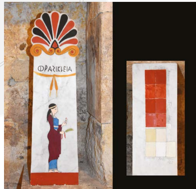
Fig. 8. Reprise de la peinture de la stèle : ajout du sourcil oublié et tests de couleurs (ocre rouge, blanc de plomb et craie) avec différents liants (jaune d'œuf, gomme arabique, caséine, blanc d'œuf) additionnés ou non d'huile de lin.