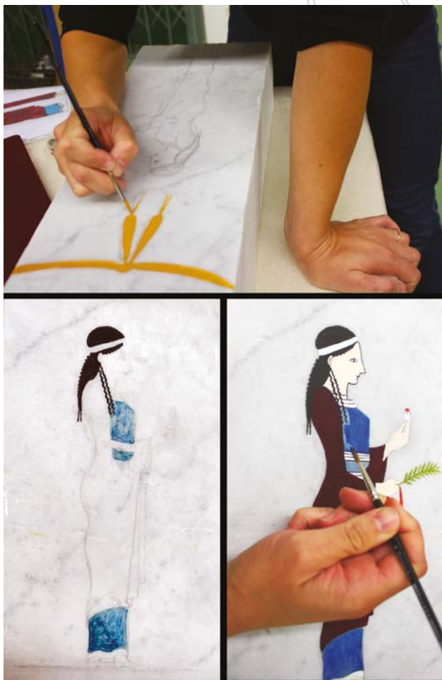
Fig. 7. Peinture de la stèle expérimentale, posée à plat ; application de deux couches de bleu égyptien.

Aucun traitement de surface n'a été appliqué après la peinture, car nous manquions de données sur ce point. Nous savions que la stèle resterait en intérieur et pensions que le décor tiendrait ainsi toute la durée de l'exposition, c'est-à-dire cinq mois. Pourtant, au bout de deux mois, les couleurs de la carnation ont commencé à s'effacer peu à peu... La raison du manque d'adhérence de la couche picturale à cet endroit-là provient peut-être du mélange de pigments et/ou de leur réaction avec la caséine. Quoi qu'il en soit, nous avons procédé à une réfection de la carnation le 11 janvier 2018, in situ , à l'œuf cette fois et depuis lors, la peinture a bien tenu. La dernière intervention picturale sur la stèle a eu lieu après la clôture de l'exposition, le 3 novembre 2018 en atelier. Il s'agissait de réparer un oubli qui n'avait été relevé que par très peu d'observateurs : le sourcil, pourtant positionné lors