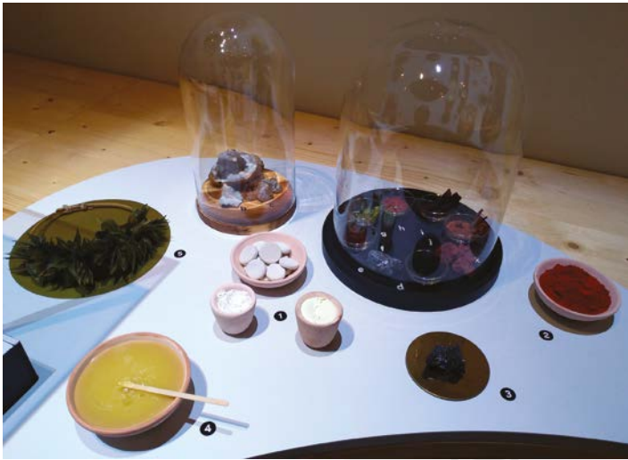
Fig. 1. Plateaux sensoriels réalisés par Amandine Declercq ( Les fées bottées ) : maquillage et autel avec offrandes végétales.