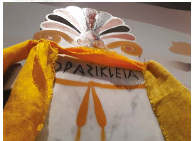
Fig. 10. Reflet de l'huile dispersé sur le haut de la stèle expérimentale vue en lumière rasante.