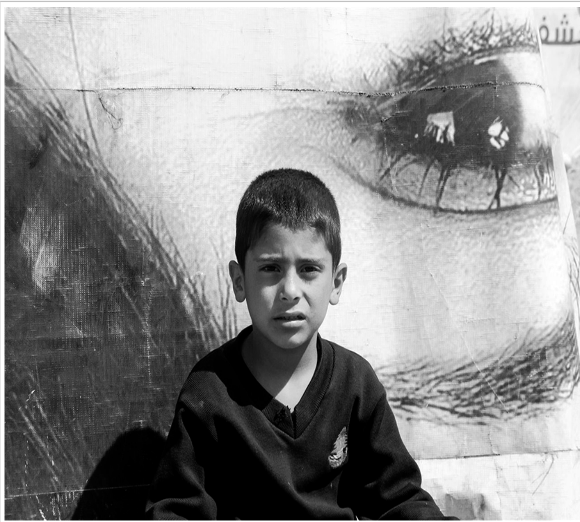
Photo de Jocelyne Saab (avec l' aimable autorisation des ayants droit).

Alors que beaucoup d'habitants de Beyrouth préfèrent que les réfugiés syriens restent invisibles, souhaitant qu'ils demeurent à l'extérieur de la ville, Jocelyne Saab expose de grands portraits d'enfants syriens de la plaine de la Beka'a au cœur même de la capitale en les suspendant à des grues, non pas de façon misérabiliste mais grandiose. Elle rend ainsi à ces enfants, dont les visages se détachent sur le ciel bleu azur, leur caractère majestueux, sacré, angélique et iconique. Par ces deux installations, celle des grandes photos peintes et celle du slogan non plus publicitaire mais humanitaire : « Comment vivre avec un dollar par jour ? », l'artiste réinstalle l'espace du camp, tout au moins en images et en mots, à l'intérieur même de la cité, au sens spatial et politique.