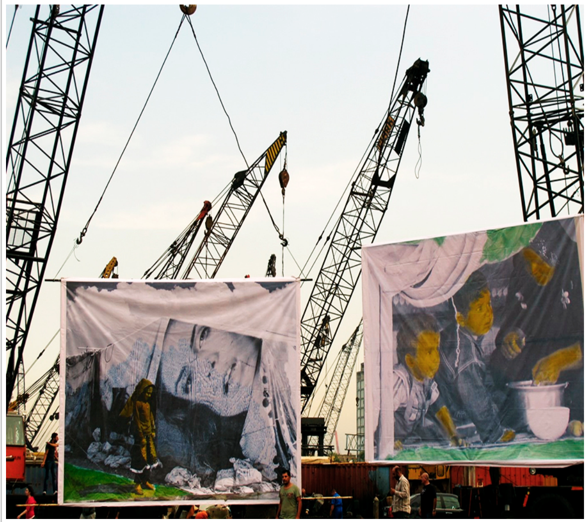
Photo de Jocelyne Saab (avec l'aimable autorisation des ayants droit).

À la différence de ce qu'on pourrait penser au premier abord en voyant One dollar a day , la vidéaste n'a pas surimprimé au moyen d'effets cinématographiques des images publicitaires d'objets de luxe sur les tentes des réfugiés mais les bâches publicitaires constituent le tissu même des tentes. De même, elle n'a pas superposé les photos d'enfants syriens sur l'image du ciel de Beyrouth ou inséré au montage « Comment vivre avec un dollar par jour ? » sur une séquence représentant des panneaux publicitaires, mais, dans les deux cas, il s'agit d'installations artistiques exposées au sein même de l'espace public.