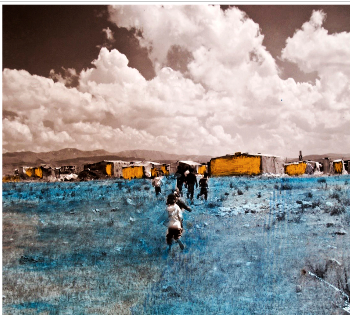
Photo de Jocelyne Saab (avec l'aimable autorisation des ayants droit).

ignorer, de témoigner de ce qu'on voudrait occulter, de faire apparaître ce qu'on souhaiterait voir disparaître. L'écran cinématographique, comme la toile de tente des migrants, est certes un refuge fragile[32] ( /numeros/9/Pages/09-08.aspx#_ftn39 ), mais il permet leur survie en image, même lorsque ceux-ci ne sont plus en vie. Le cinéma ne peut sauver des vies, mais peut sauver de l'indifférence, de l'oubli et de la disparition. Les films sur les migrants font mémoire et permettent de nous interroger sur notre responsabilité, notre résignation, notre résistance et notre engagement.