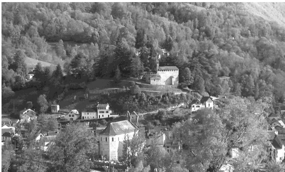
Sommet du village de Castillon-en-Couserans. Le château a disparu, on aperçoit l'église castrale fortifiée.