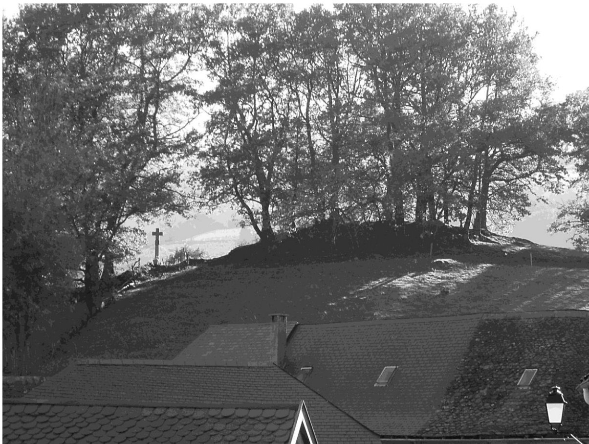
Site de l'église disparue Sainte-Eulalie à Orchein – Photo F. GUILLOT.