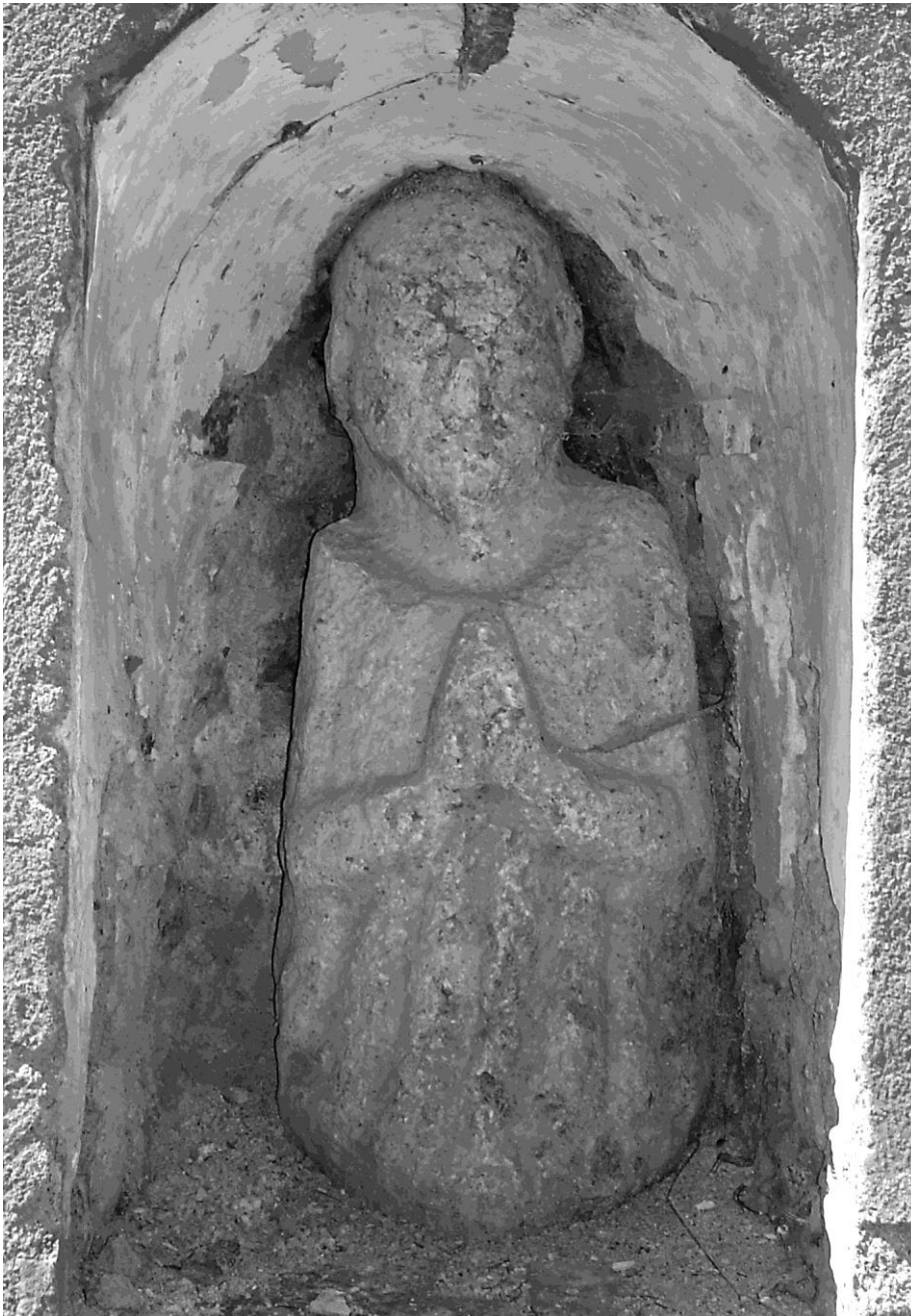
Petite sculpture d'origine inconnue au bord d'une rue dans le village de Castillon-en-Couserans.