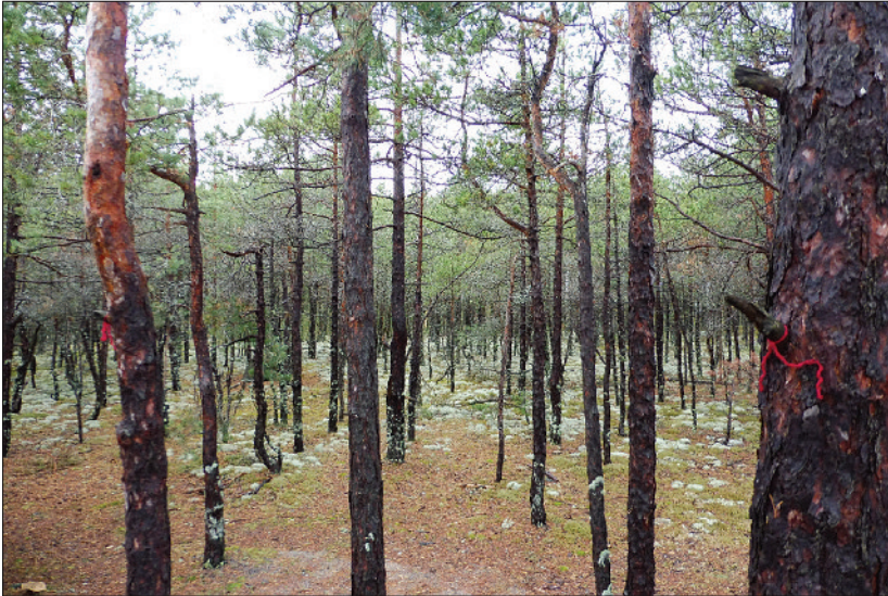
Photo 2 Signes de tissu sur les arbres à proximité de la roche sacrée de l'île de Kihnu (Estonie), Liiva-aa Kivi , 2018

(photo 2, ci-dessous). Ces signes sont visibles au travers d'un patrimoine culturel immatériel riche et éclectique, allant de la taxonomie vernaculaire ou l'onomastique locale (Berezovič et Stépanoff, 2008 ; Cogos, Roué et Roturier, 2017) aux représentations spatiales (Arukask, 2011), ou aux rituels chamaniques (Mägi et Toulouze, 2002), avec parfois l'arbre érigé en symbole (Belenitskaïa, 2018).