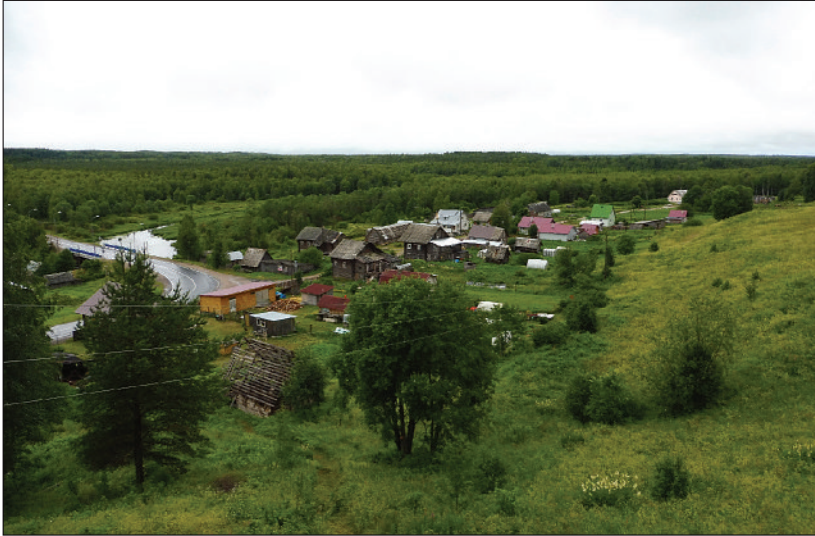
Photo 1 Le village carélien forestier de Menga ou Manga (République de Carélie), en 2017

d’avoir des peuplements archipélagiques, au milieu d’espaces naturels vastes (sames, vepses, caréliens). Leur habitat est ainsi très isolé et dispersé, en habitat individuel ou en villages forestiers (photo 1, ci-dessous) ou campements nomadisant (Cogos, Östlund et Roturier, 2019). À l’inverse, d’autres de ces peuples sont concentrés sur des territoires de très petite taille, isolés, comme le lude, l’ingrien, le vote et le live (parfois au sein de deux ou trois villages seulement).