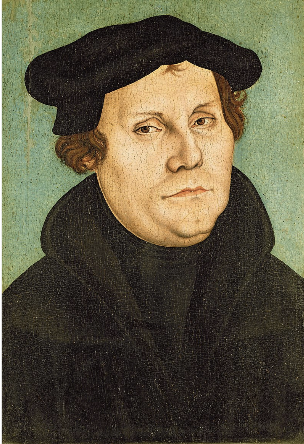
1528, Lucas Cranach der Ältere