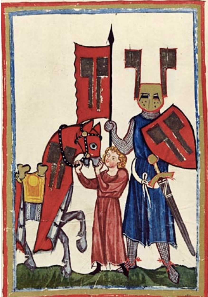
Wolfram von Eschenbach, Codex Manesse Wikipedia: Wolfram von Eschenbach Codex Manesse , UB Heidelberg, Cod. Pal. germ. 848, fol. 149v: Herr Wolfram von Eschenbach