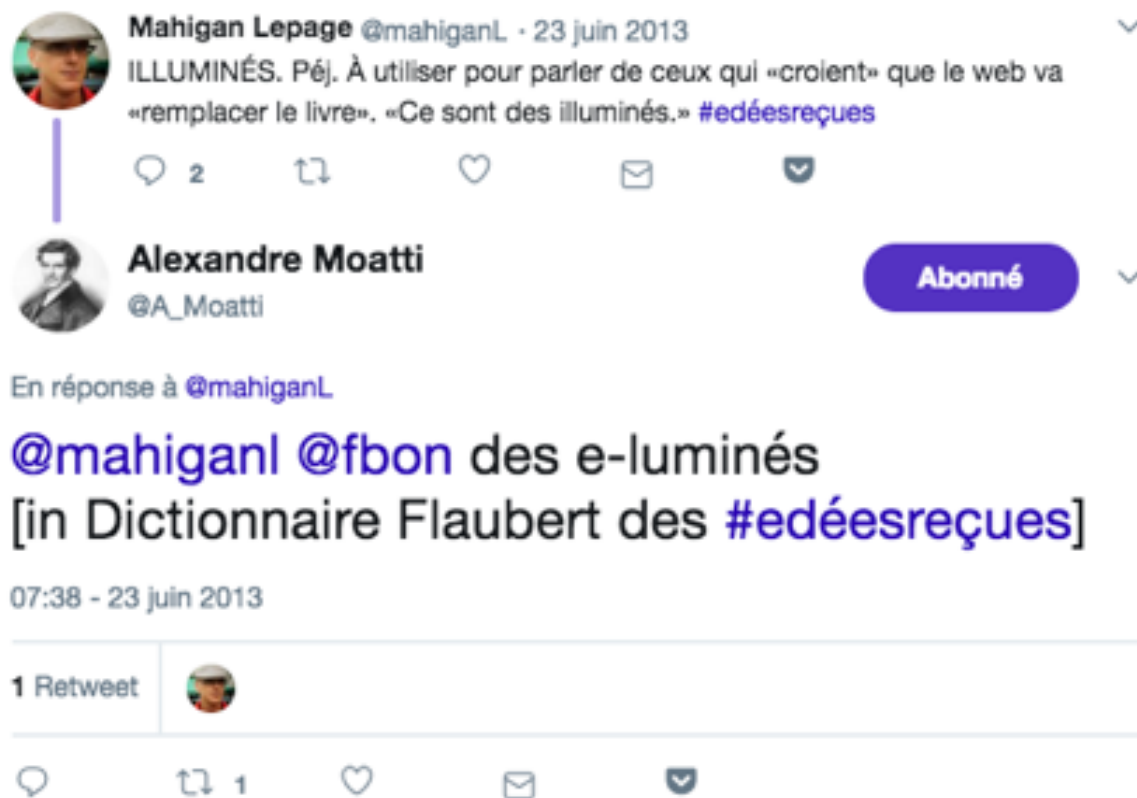
Figure 6. Entrée « illuminés »

Dans ces conditions, comment étendre la signification de ces énoncés en dehors de leur espace natif, en dehors de Twitter, comme s'y était engagé l'auteur au cours du projet ? Bref, comment passe-t-on du sens, toujours contextualisé, situé, à la signification, c'est-à-dire au sens stabilisé et partagé par une diversité de locuteurs ?