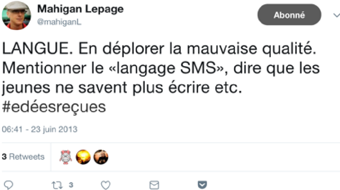
Figure 3 – Renvoi à l'entrée « langue » dans l'entrée « écrivain » [11]