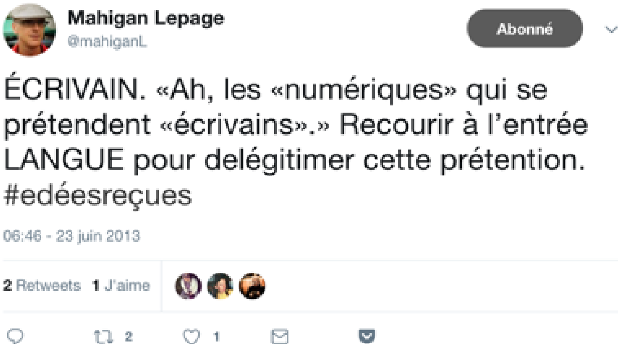
Figure 8. Entrée « écrivain » sur Twitter

Cette forme peut être qualifiée d'aboutie parce qu'elle actualise le potentiel de l'ordre discursif du dictionnaire sur Twitter. En effet, certaines entrées comprenaient des renvois sur lesquels il était techniquement impossible de cliquer : le lecteur devait parcourir l'ensemble des énoncés sous le mot-clic « edees-recues » pour trouver l'entrée correspondante (Figure 8). Dans l'ordre numérique du volume ou du livre, ce problème a été réglé par l'introduction de liens hypertextuels, d'un index, d'un découpage textuel (Figure 9). Autrement dit : les deux ordres ont trouvé leur forme d'expression satisfaisante, celle qui permet de maximiser leurs potentialités.