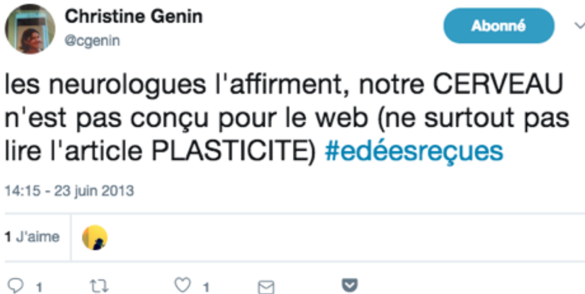
Figure 5. Entrée « cerveau »[13]

Cela dit, ses « membres » n'ont pas toujours adopté sa forme attendue, avec une entrée suivie d'une définition (Figures ci-dessous). Dans ces cas, les entrées sont intégrées syntaxiquement dans l'énoncé et fragilisent la cohérence de l'ordre initial, même si les entrées indiquent s'y rattacher en respectant le code graphique proposé (les lettres capitales). Dans d'autres cas, plus rares, l'entrée d'un contributeur n'est compréhensible que dans sa relation sociale, technique, syntaxique à une autre entrée : la comprendre impose donc de la saisir contextuellement, comme on peut le voir dans l'exemple ci-dessous (Figure 6) où un contributeur élabore une entrée en répondant à Mahigan Lepage et à François Bon.