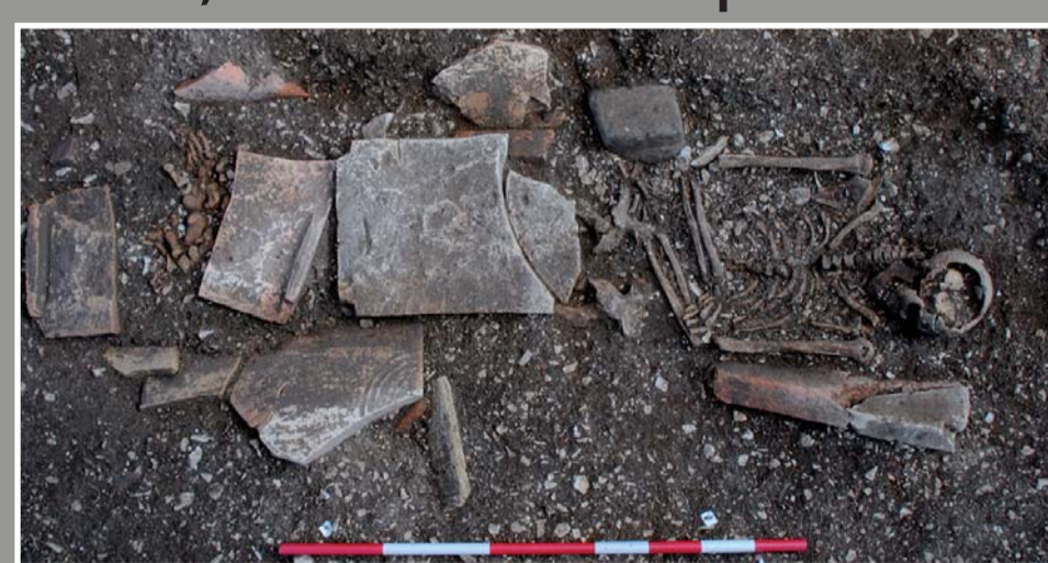
Vues nadirales des sépultures SP 1, SP 13 et SP 8

Les dispositifs funéraires témoignent de sépultures sous tegulae ou simplement en linceul. Aucun dépôt d'accompagnement n'a été identifié mais quelques éléments de parure portés par les défunts sont toutefois présents dans certaines tombes (bracelet, boucle d'oreille, perles). Un collier composé de perles et d'un médaillon en verre à l'effigie de Sabazios, divinité orientale, destiné à un périnatal (SP 9) pourrait témoigner d'une volonté de protection face à la mort de ce jeune sujet.