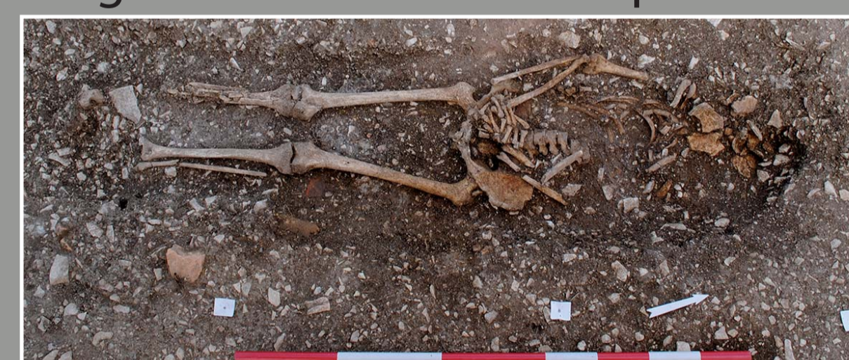
SP 1 - Sujet adulte de sexe masculin inhumé dans un coffrage de tegulae Datation 14 C : 392-638 cal. AD