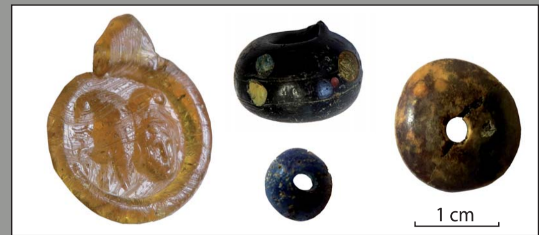
SP 9 - Sujet périnatal inhumé avec un collier de médaillon (Sabazios) et perles en verre Datation IV e siècle

Une portion de l'espace funéraire, composé de 16 inhumations, a été dégagée de part et d'autre d'un bâtiment du Haut-Empire, détruit à l'Antiquité tardive. Le mobilier archéologique et la datation radiocarbone indiquent une occupation comprise entre le IV e et le début du VI e siècle. Pour cette même période, les textes mentionnent la fondation éphémère d'un évêché et de son élévation au rang de civitas dans cette vallée. Si, a priori Thorame-Haute est le meilleur prétendant au titre de l'évêché éphémère du V e siècle (non localisé à ce jour), les résultats acquis à Saint-Pierre 2 sème le doute.