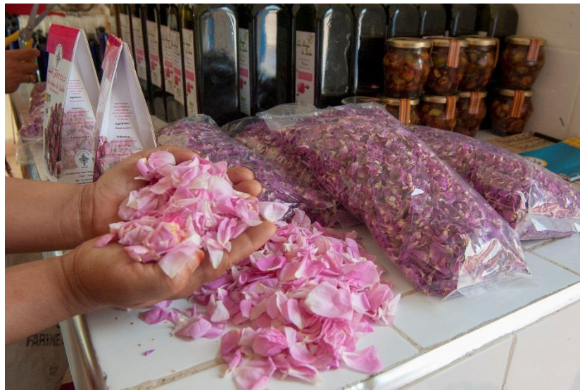
Photos 1 et 2 : Plantations des rosiers sous forme de clôture des champs et pétales séchées