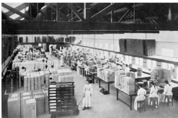
Fig. 2 – Chocolaterie Cadbury à Bournville : atelier d'emballage, 1903.