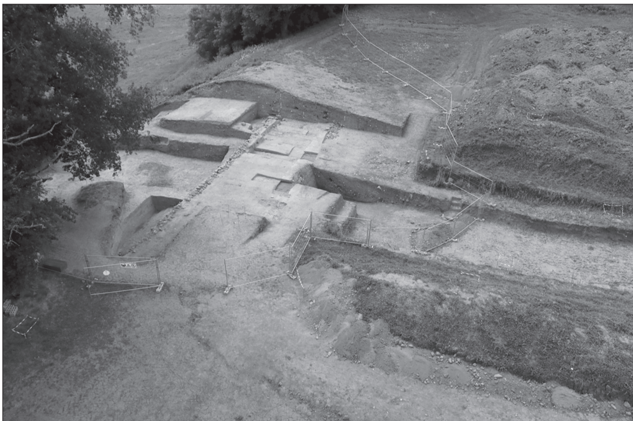
Fig. 1 : Vue générale de la fouille des remparts en 2018

En 2016, une fouille exploratoire sur le rempart massif a révélé un modèle d'ouvrage militaire bien plus complexe que ce que nous avons pu imaginer. Les nouvelles données sur le talus massif, en l'occurrence la monumentalité et la complexité technologique, s'accordent avec l'énorme fossé à fond plat de 45 m