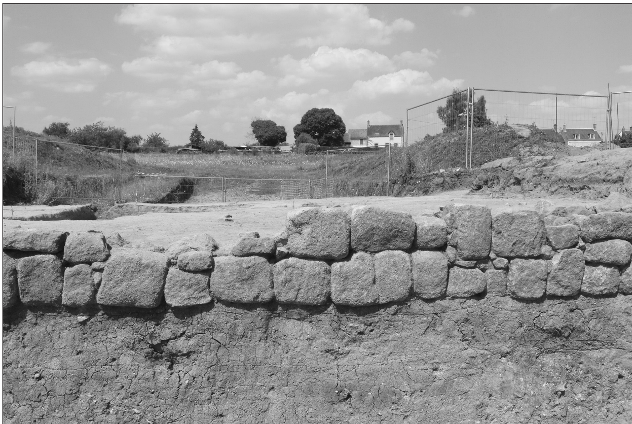
Fig. 2 : Vue du parement en grès de la première phase du rempart

de largeur mis au jour en 2002 au pied du rempart. En 2018, une campagne estivale de deux mois s'est concentrée sur le rempart avec deux objectifs majeurs : le premier concerne une approche globale de l'architecture et de l'ingénierie militaire des fortifications de Châteaumeillant (rempart à poutrage et rempart massif) ; le second porte sur l'élaboration d'une synthèse de la chronologie de l' oppidum gaulois en confrontant l'ensemble des données acquises dans l'habitat et sur les fortifications.