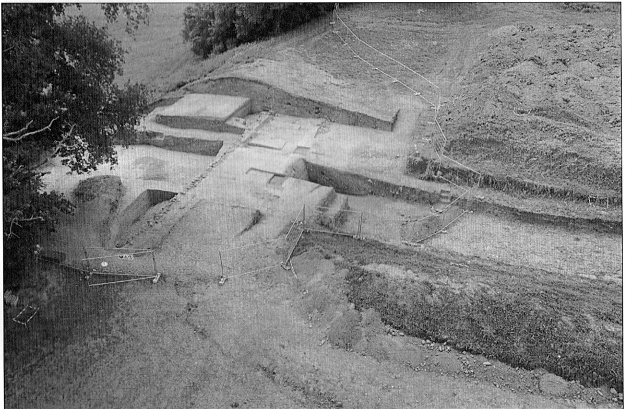
Fig. 1 : Vue générale de la fouille des remparts en 2018

En 2016, une fouille exploratoire sur le rempart massif a révélé un modèle d'ouvrage militaire bien plus complexe que ce que nous avons pu imaginer. Les nouvelles données sur le talus massif, en l'occurrence la monumentalité et la complexité technologique, s'accordent avec l'énorme fossé à fond plat de 45 m