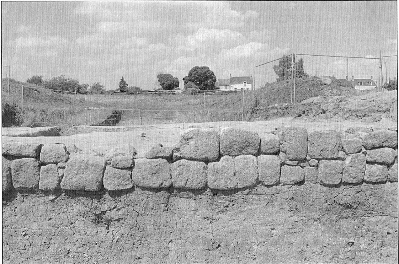
Fig. 2 : Vue du parement en grès de la première phase du rempart

de largeur mis au jour en 2002 au pied du rempart. En 2018, une campagne estivale de deux mois s'est concentrée sur le rempart avec deux objectifs majeurs : le premier concerne une approche globale de l'architecture et de l'ingénierie militaire des fortifications de Châteaumeillant (rempart à poutrage et rempart massif) ; le second porte sur l'élaboration d'une synthèse de la chronologie de l' oppidum gaulois en confrontant l'ensemble des données acquises dans l'habitat et sur les fortifications.