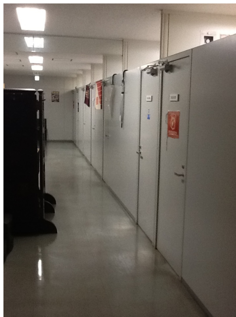
Photo montrant l'intérieur du club de presse d'un commissariat départemental

Si l'auteur de ces lignes partage cette critique, il remarque aussi qu'on parle moins souvent de ce que les journalistes font vraiment à l'intérieur d'un club . D'un point de vue sociologique, les clubs de presse jouent un rôle central dans le système médiatique japonais. Pour reprendre une notion du sociologue américain Herbert Gans (2004), ils remplissent une fonction « d'amplificateur d'opportunité », en mettant en relation de manière quasi-permanente les journalistes et les sources institutionnelles. En dehors de leur dimension monopolistique, ce qui distingue ces clubs d'autres associations telles que le groupe couvrant la Maison Blanche ou la salle de presse de l'Élysée, c'est leur présence systématique sur l'ensemble du territoire (environ 800 clubs référencés).