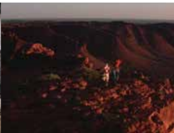
Paysage climat, paysage chromatique, paysage atmosphère qui teinte les scènes et tonalise les états d'âme.