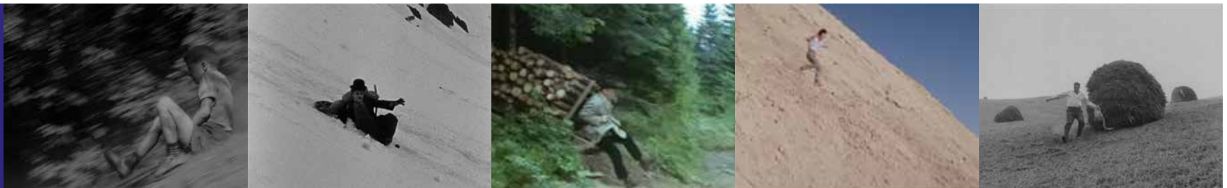
Paysage pente, paysage cailloux, paysage physique dont le relief met en action les corps.

Ça glisse, ça dévale, ça s'emballe, ça chute, ça tombe, ça roule, ça s'effondre, ça fuse.