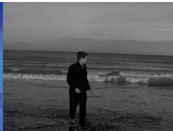
Paysage fluide, paysage eau et vent, paysage des éléments qui enveloppent la situation et la déplacent.

Ça cadre, ça pointe, ça délimite, ça expose, ça projette, ça montre, ça traduit.