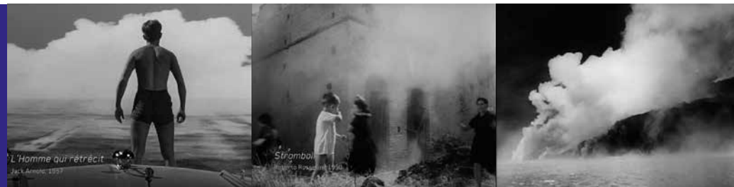
Paysage catastrophe, paysage cataclysme, paysage de fin du monde qui engendre des héros et des fous.

Ça sidère, ça affole, ça met en branle, ça effare, ça terrifie, ça transcende.