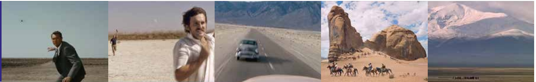
Paysage plaine, paysage plat, paysage de l'étendue vaste où les silhouettes en procession donnent l'échelle des lieux.

Ça traverse, ça s'enfuit, ça s'avance, ça s'éloigne, ça s'étend, ça singularise, ça détache.