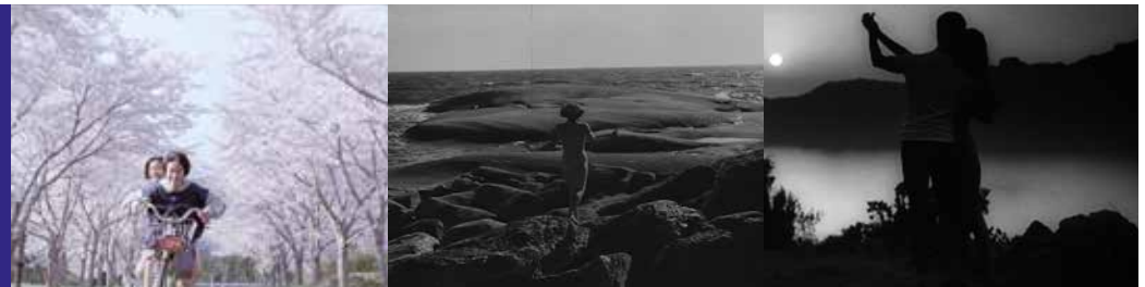
Paysage bourgeon, paysage nature, paysage charnel qui harmonise et propose la symbiose de la chair et du cosmos.

Ça met en joie, ça enivre, ça épanouit, ça transporte, ça réveille les sens, ça accueille, ça enchante.