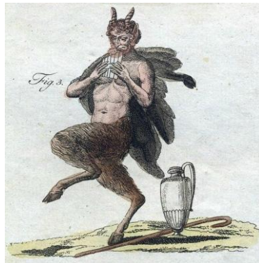
Ill. 8: Illustration (détail) de Friedrich Justin Bertuch, Kinderbuch Fabelwesen

La farce de Goethe se tient dans un univers résolument magique et ambivalent. L'illusion domine et on observe Satyros, personnage à la fois magique, magicien et manipulateur, agir puissamment sur la perception de sa nature par le peuple et ce à des fins politiques et libidineuses. Mais le sens éminemment civil de l'usage des liens magiques et de leur métamorphose nécessite prudence et raison. Ce que l'impétueux Satyros ignore. Par excès et négligence, il semble échouer dans son entreprise de gouvernance. Mais n'est-il pas, comme l'intrigant que Merck décrit à Goethe, de ceux qui « se donnent pour mission d'aller de-ci de-là », un aventurier ?