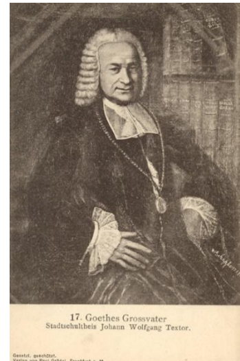
Ill. 2 : Johann Wolfgang Textor, le grand-père de Goethe

Il entourait sa naissance même, d'augures 1 , de constellations et de lune. Il habitait une enfance de frissons et de craintes du mystérieux, de l'invisible, inspirées des recoins sombres de la grande maison familiale 2 . Une enfance enrichie de spectacles de marionnettes, de théâtre de rue et d'autels enfantins, de symboles et de cérémonies officielles, traditionnelles (parfois à caractère conjuratoire à l'image de l'Audience annuelle des musiciens à l'hôtel de ville de Frankfurt) 3 . Johann Wolfgang Goethe côtoyait un grand-père influent et respecté, parfois vêtu comme un sage d'une « longue robe de chambre » et « d'un bonnet de velours noir plissé » 4 . Ce grand-père, écrit-il, « possédait le don de prophétie ». Grâce à « des songes significatifs [qui] l'instruisaient de ce qui devait arriver », il anticipa sa nomination, par tirage au sort, à la charge de maire de Frankfurt. Ces songes étaient consignés dans des carnets, sous forme de notes cryptées 5 indéchiffrables pour l'enfant curieux. La magie prémonitoire semblait ainsi doublée d'une magie des chiffres.