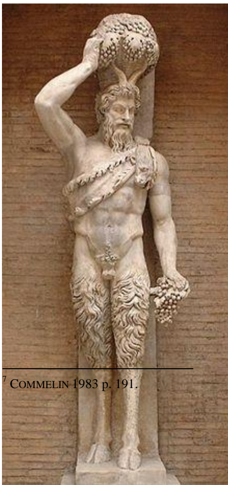
Ill. 3 : Haut-relief du dieu Pan, « satyre della Valle » Palais du Capitole, Rome

Personnage imaginaire, issu de la mythologie romaine, le faune est, comme le définissait Pierre Commelin, une créature champêtre et « rustique », plus joyeux et moins violent dans ses amours que le satyre grecque 7 . Plus proche des contrées agricoles où il se repaît du travail des hommes que d'une nature profondément sauvage, il a une forme humaine (tableau faune et bacchante de William Bouguereau, 1861) à l'exception de sa queue et de ses oreilles (marbre faune borghese , anonyme, XVIII e siècle, musée Cognacq-Jay). Satyros est-il un faune, être magique par excellence, comme le laissent penser certaines traductions (E. Herrmann) du titre du drame de Goethe ?