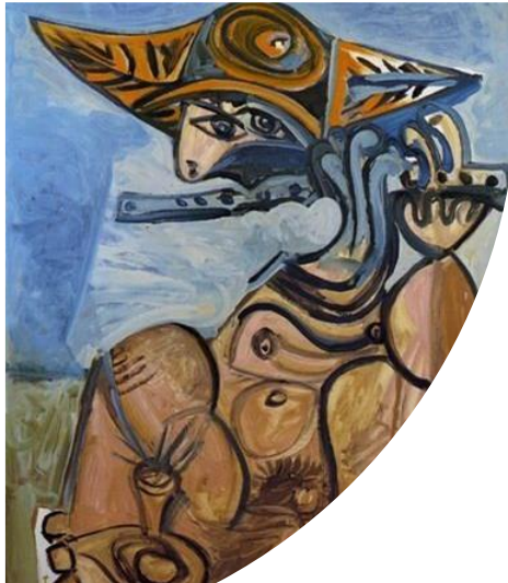
Ill. 1 : Le flutiste Homme assis jouant de la flute, 1971, Pablo PICASSO

« Il est autant de sens du mot magie que de sortes de mages »