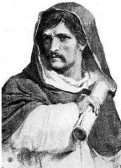
Ill. 5 : Giordano Bruno

Suivant les différentes formes de magie listées par Giordano Bruno dans son De la magie 19 , Satyros semble exercer une magie dite « mathématique » faite d'incantations musicales et de fascination du regard. Il se pose ainsi en « intermédiaire entre les magies divines et naturelles » 20 .