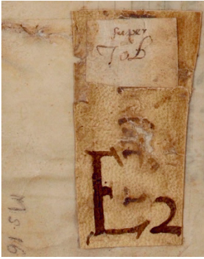
Fig. 2 – Avranches BM, 16, f. 1r. Morceau de parchemin collé portant cote ancienne et titre du manuscrit : Super Job E 2