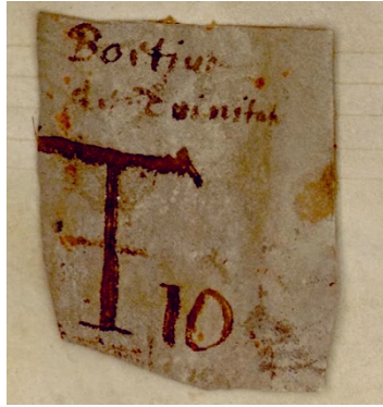
Fig. 1 – Avranches BM, 86, f. 137r. Exemple de morceau de parchemin collé portant cote ancienne et titre du manuscrit : Boetius de Trinitate T 10