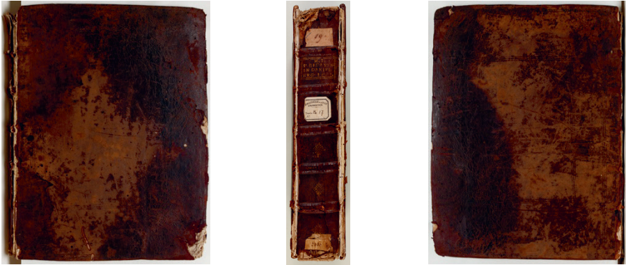
Fig. 4, 5 et 6 – Reliure non restaurée du manuscrit Avranches BM, 17 : plat supérieur, dos et plat inférieur

de ces gardes et plus particulièrement du filigrane qui nous a amenés à dater plus précisément la campagne de reliure, en partant du postulat que les reliures mauristes sont contemporaines, à quelques années près, de la production du papier filigrané.