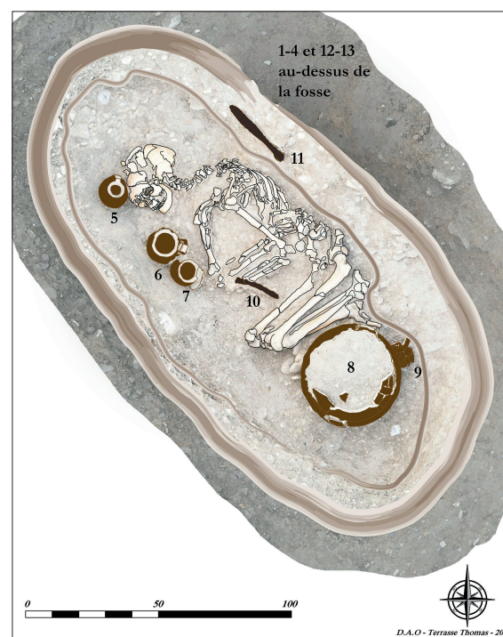
Fig. 22 - La tombe SDC 2015.1 et son mobilier (DAO T. Terrasse).

Cfr. Lo Porto 1974, p. 116, tav. VII, 2 (associata a coppe ioniche B1, primo terzo del VI secolo a.C.); Russo Tagliente, Berlingò 1992-1993, p. 288-289, fig. 34.