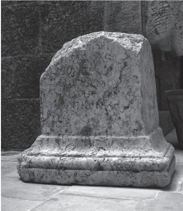
1. Autel de Jbayl (ou Beyrouth ?), Musée Marie Baz