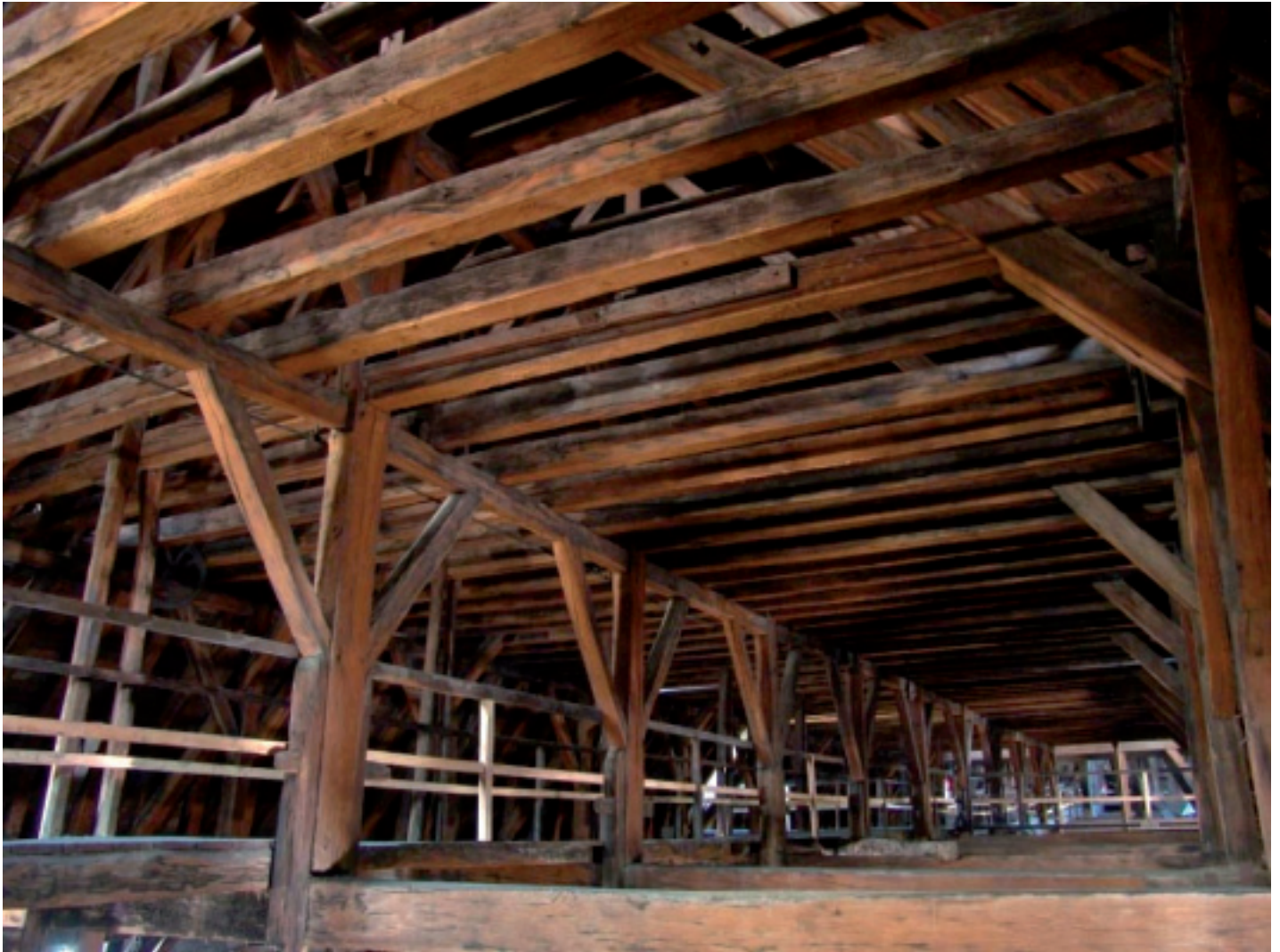
Fig. 1. Charpente gothique de la nef de la cathédrale Notre-Dame de Paris.

La destruction des toitures de Notre-Dame représente une immense perte scientifique pour la connaissance des grandes charpentes du XIII e siècle (fig. 1). Pour en mesurer la portée, il est nécessaire de faire un état des connaissances sur la structure et sur les bois d'œuvre, avant d'aborder succinctement quelques questions sur sa possible reconstruction.