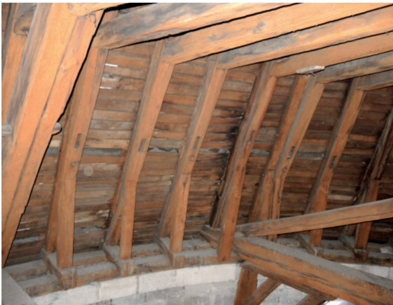
Fig. 2. Charpente de l'abside mise en place vers 1220 avec en réemploi les chevrons montrant les mortaises vides de leur première utilisation vers 1160-1170.