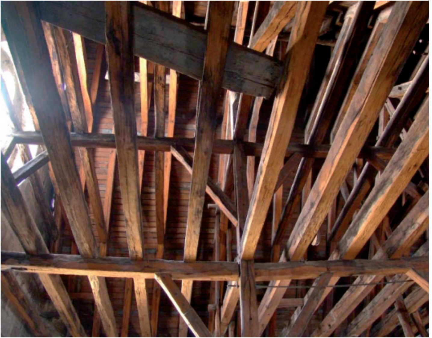
Ci-dessus. Fig. 7. Liernes longitudinales supportant les fermes secondaires pour transmettre leurs charges aux poinçons des fermes principales.