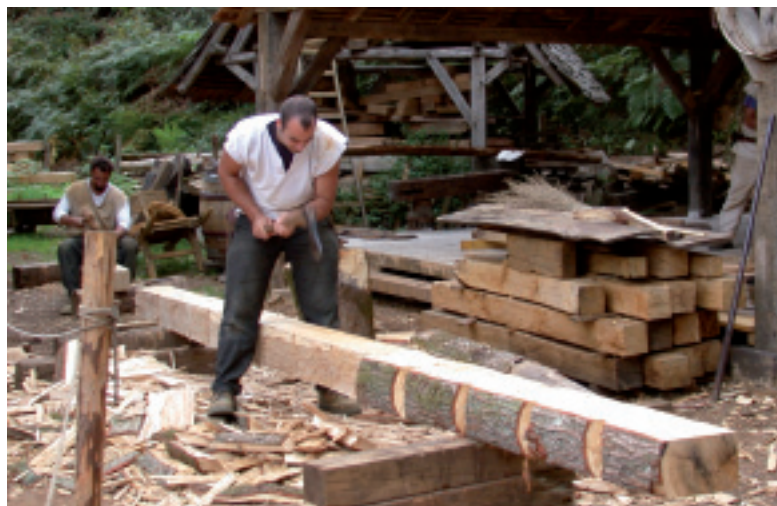
Fig. 3. Tranche d'une poutre du XIII e siècle de la charpente de la cathédrale de Bourges. Elle montre un jeune chêne à croissance rapide qui conserve de l'aubier en périphérie.

On estime que la construction de la charpente gothique de Notre-Dame a nécessité l'abattage de près de 1000 chênes. Environ 97 % d'entre eux provenaient de fûts de 25-30 cm de diamètre et de 12 m de long maximum (fig. 5). Le reste, soit 3 %