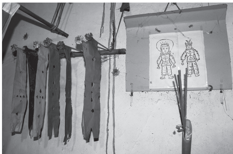
Les esprits auxiliaires d'une chema à gauche, ceux d'un bimo à droite (Weizji; cliché A. Névoit, novembre 2013)

Elles n'officient plus mais demeurent des chema à part entière et gardent chez elles leurs esprits auxiliaires/esprits-fils jusqu'à la fin de leur vie — ils s'en retourneront ensuite dans la grotte ancestrale.