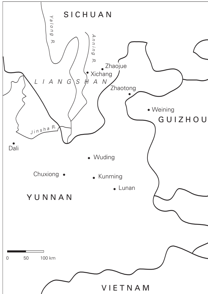
CARTE 1 — Répartition ethnique des Yi dans les provinces du Guizhou, du Sichuan et du Yunnan (d'après Harrell 1995 : 64).

De fait, la nationalité yi, yizu 彝族, regroupe les « Lolos soumis » d'avant la Révolution. Sous ce terme générique yizu , l'identité des groupes rassemblés demeure toujours indéfinie. Le classement officiel chinois reconnaît pourtant que les Yi sont divisés en plusieurs branches ( zhixi 支系), dispersées sur les rebords des hauts plateaux du Yunnan, du Guizhou et au sud du bassin du Sichuan, sur les « Grandes Montagnes fraîches », Daliangshan . La branche sani ( sani zhi 撒尼支) est située dans le district de Lunan, à une centaine de kilomètres à l'est de