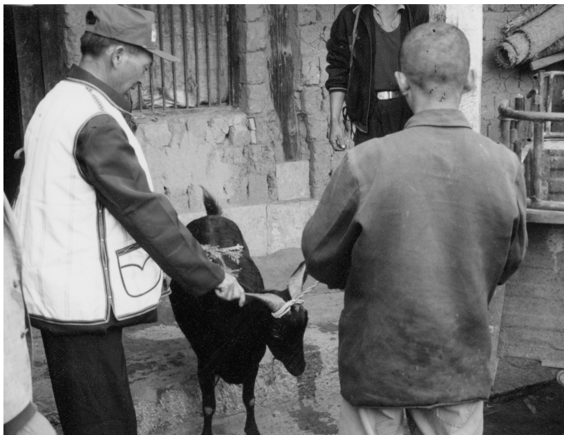
ILL. 2 — Le bimo purifie l'animal sacrificiel en récitant une formule secrète.