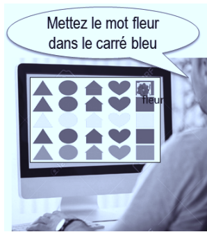
Figure 2: Module « Intelligibilité » de « MonPaGe_Passation ».

Le module « pseudo-mots » vise à examiner l’articulation des consonnes et voyelles du français. Celles-ci sont placées dans 53 pseudo-mots respectant la phonotactique du français (ex: ‘rafau’, ‘tabon’, ‘laspa’...). Les facteurs de complexité phonétique et phonologique sont manipulés à différents niveaux (moteurs et structurels), tels la structure syllabique, la longueur syllabique, la position dans le mot, le contexte phonétique (phénomènes de coarticulation), la fréquence syllabique ainsi que l’alternance des mouvements et des syllabes. Les items sont présentés par ordre de complexité croissante.