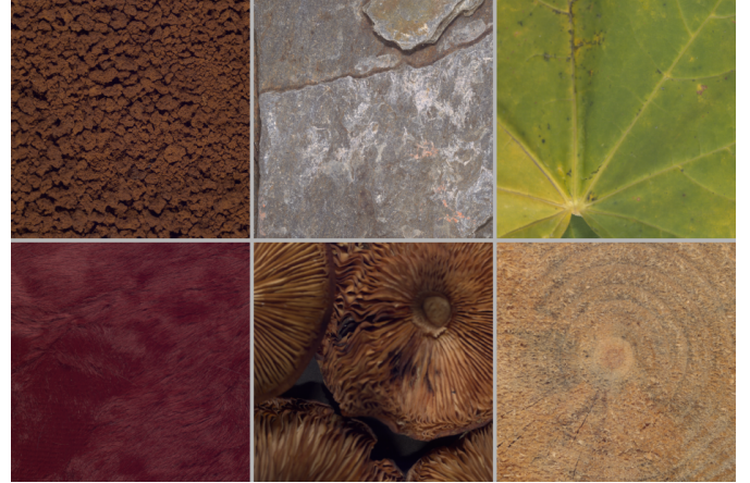
FIGURE 3 – Échantillons d'images de la base de textures HyTexiLa. Pour une meilleure visualisation, les images multispectrales sont représentées en sRGB sous l'illuminant D65.

Pour effectuer une classification expérimentale de textures, nous utilisons la base de données HyTexiLa [5] qui contient 112 images de réflectance de textures dont six sont représentées sur la Fig. 3. Nous simulons chaque image multispectrale de radiance pleinement définie à partir de la réflectance de chaque texture en utilisant l'illuminant D65 et la fonction de sensibilité spectrale relative associée à chaque bande des différents MSFA. Enfin, nous échantillons les images ainsi obtenues selon les différents MSFA afin de simuler les images brutes qui seraient acquises par les caméras associées. Pour chacune des quatre caméras considérées, ces simulations fournissent 112 images brutes de taille 1024 \times 1024 pixels. Chaque image est ensuite divisée en 25 sous-images de taille 204 \times 204 pixels, parmi lesquelles douze sont choisies au hasard pour l'apprentissage et les treize autres sont retenues pour les tests. Afin de déterminer le descripteur de texture le plus discriminant, nous retenons le classifieur « plus proche voisin » associé à la mesure de similarité basée sur l'intersection d'histogrammes car ce schéma de classification ne nécessite aucun paramètre.